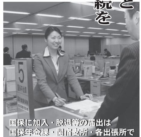
国保に加入・脱退等の届出は 国保年金課・関宿支所・各出張所で

▼加入の届出が遅れると 保険証がないため医療費を全額自己負担しなければなりません。 また、加入すべき月（退職の翌日、転入日等）まで遡って国保税を納めなければなりません。国保税の納付義務は、届出した日ではなく、異動した日に発生します。 ▼やめる（脱退）届出が遅れると 国保の資格が無くなっていくにもかかわらず、保険証を使って医療機関で受診してしまうと、国民健康保険で負担した医療費を返していただくことになりません。 また、いつまでも国保加入者として資格が継続するため、国保税がかかり続けます。