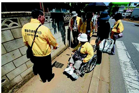
福祉のまちづくりパトロール

日本人の平均寿命が延びている一方で、高齢化の進行に伴う生活習慣病等の患者数の増加が懸念されており、市民一人一人が生涯にわたり健康づくりに取り組むことが求められています。また、少子高齢化の進行、雇用基盤の変化、医療の高度化等、医療を取り巻く環境は大きく変化しており、医療ニーズは年々高まっています。このような状況を踏まえて、スポーツや食生活改善等による健康増進や疾病予防、介護予防等に取り組むとともに、小児医療や障がい者医療、高齢者医療等のニーズに対応した医療体制の充実に努めます。また、かかりつけ医の定着や介護サービスの充実、各医療機関の連携体制の確保等にも取り組み、住み慣れた場所で自分らしい生活を送ることができる医療環境づくりを進めます。