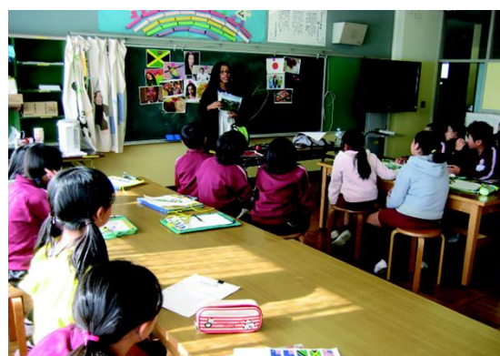
異国文化体験教室