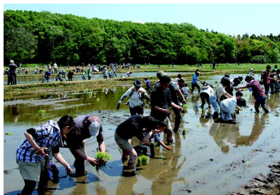
江川地区での米作り体験