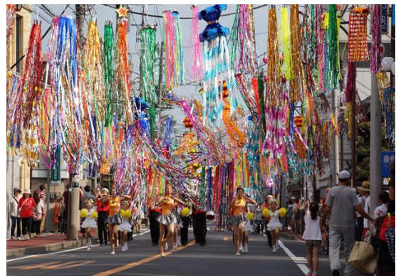
野田夏まつり躍り七夕