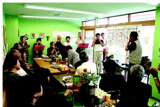
高齢者の身近な交流の場（シルバーサロン）