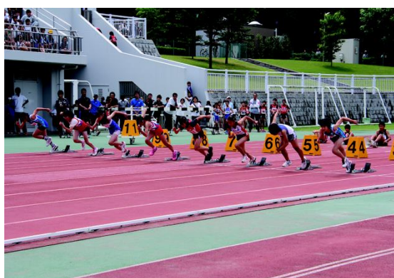
小学校陸上競技大会

野田市においても、今後ますます国際化が進み、市内在住の外国人の増加が予想されることから、外国人も地域で安心して生活できる環境づくりを進めます。また、市民の国際感覚の醸成や国際社会に適應できる人材育成等を目指して、国際交流の機会や場の充実を図ります。