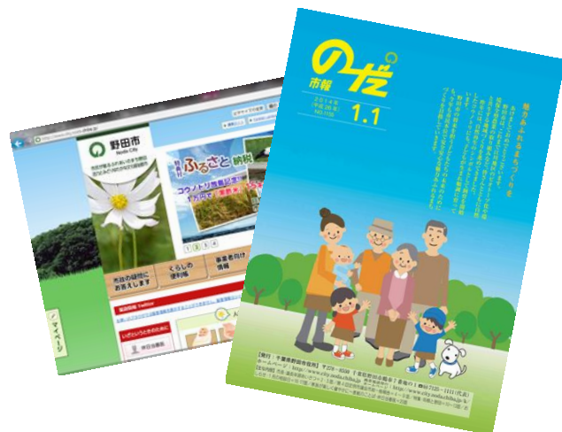
ホームページ、市報