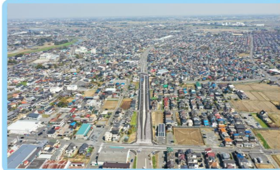
5 松伏町松伏地内 (主要地方道葛飾吉川松伏線交差点付近)