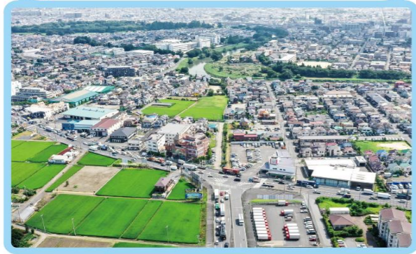
1 越谷市神明町二丁目地内 (国道4号交差点付近)