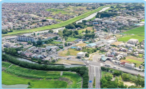
3 越谷市大吉地内 (主要地方道越谷野田線交差点付近)