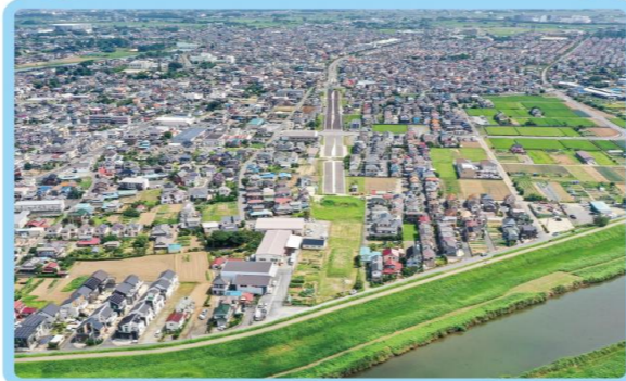
4 松伏町松伏地内 (大落古利根川左岸付近)