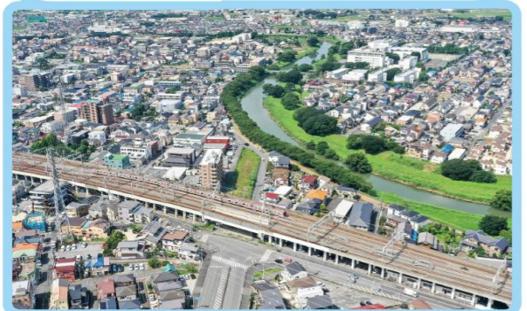
2 越谷市大房地内 (東武伊勢崎線交差点付近)