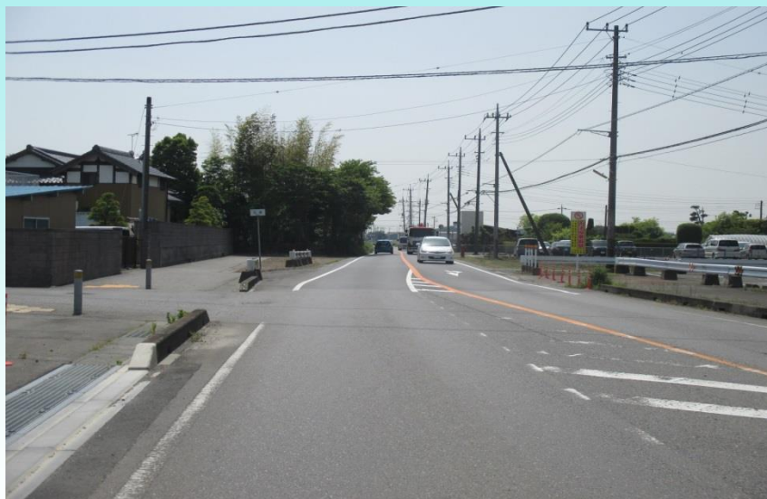
E つくばみらい市加藤地内 歩道必要区間

特に朝夕は、つくば研究学園都市や守谷市に向かう車両が多く、歩行者やドライバーの安全のためにも、早期の歩道整備を要望いたします。