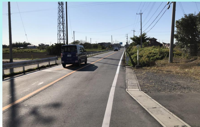
F つくばみらい市西櫛戸地内 歩道必要区間