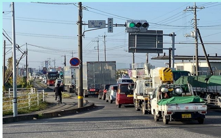
B 坂東市 矢作交差点付近