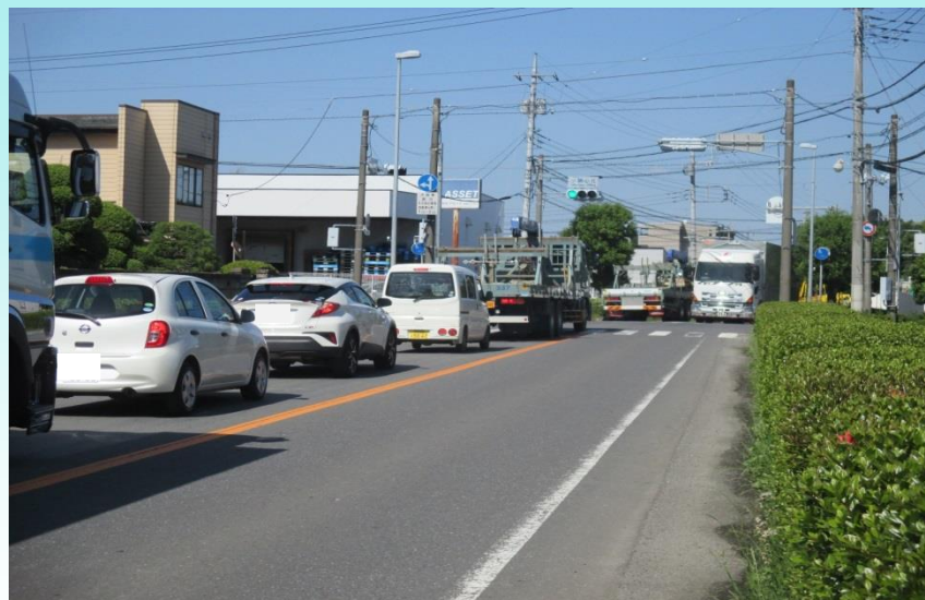
D つくばみらい市 R294号付近