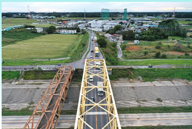
A 野田市 芽吹大橋付近

慢性的な渋滞緩和の観点から、両市の地域住民の悲願でもある芽吹大橋の4車線化の早期実現を強く要望いたします。