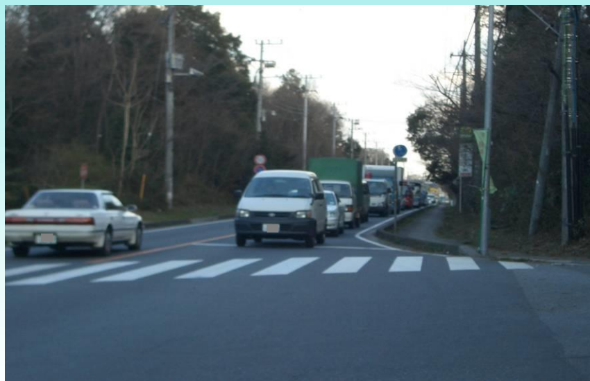
C 常総市 内守谷交差点付近

新興住宅地も隣接しており、住民要望も極めて強く、4車線化の早期完成を要望いたします。