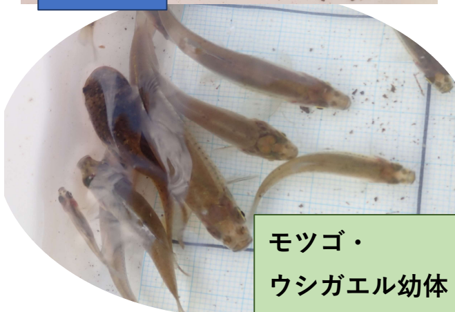
モツゴ・ウシガエル幼体