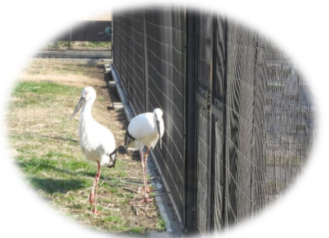
餌を待つコウくん&コウちゃんの様子