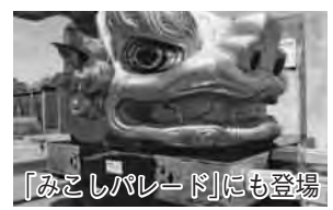
「みこしパレード」にも登場