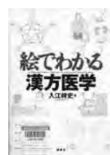
「絵でわかる漢方医学」 入江祥史・著 講談社

①卓球初心者サークル(金曜コース)：11月5日～26日の(土)14時～15時30分。全4回。30人(抽選)。②やさしいヨガ：11月5日～26日の(土)11時～正午。全4回。20人(抽選)。③スリムヨガ：11月5日～26日の(土)14時～15時。全4回。20人(抽選)。いずれも20歳以上で費用は千500円。①はラケット持参。②③はヨガマット持参。申込みは10月31日(日)必着で電話か往復はがきで住所、氏名(ふりがな)、年齢、☎を明記(1家族1通)し、〒270-0225平井40関宿総合公園