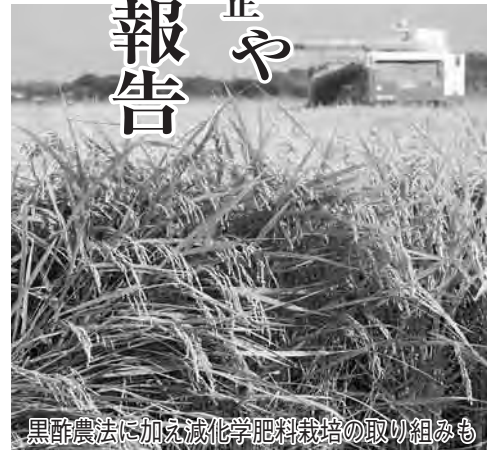
黒酢農法に加え減化学肥料栽培の取り組みも

また、運行計画変更のパブリック・コメントは、42人から196件の意見を頂き、運行計画案へ反映し、検討専門委員会に再度伺い、運行計画案をまとめる考えです。見直し後のルート運行を来年4月から予定していますが、許認可などに3か月程度要するため、債務負担行為の補正予算を計上しています。◆学校耐震補強工事 第一中学校 校管理・特別教室棟は、夏季休業