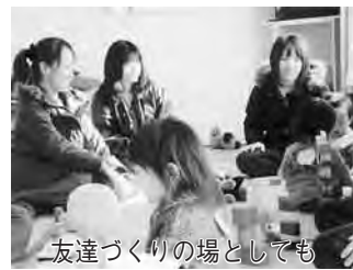
友達づくりの場としても

宮崎・柳沢地区社会福祉協議会は、平成12年1月に、「宮崎・柳沢地域福祉ネットワーク」として発足し、同年7月には、「自治会単位のボランティア組織」を目指して、現在の組織に移行しました。