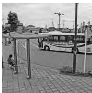
隣接地には無料の自転車等駐車場が