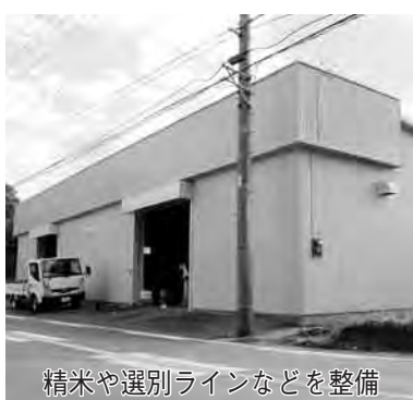
精米や選別ラインなどを整備

などを行う施設は、ちば東葛農 業協同組合の協力で、同組合の 倉庫を活用して、木間ヶ瀬地先 に整備しました。