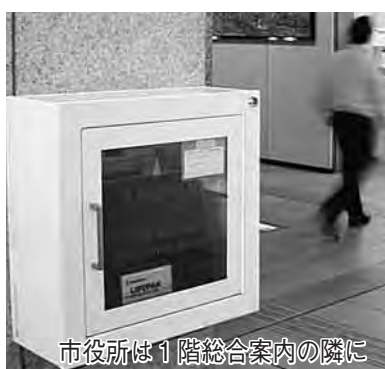
市役所は1階総合案内の隣に

◆ゆめ半島千葉国体 10月1日から4日のバドミントン競技会は、11チーム44人が関宿総合公園体育館と総合公園体育館に結集します。