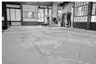
市民の研究グループが解説を

郷土博物館では、収蔵品として昨年度入手した、明治時代初期の「関宿台町文書」96点を9月12日に、市民会館で特別公開した。