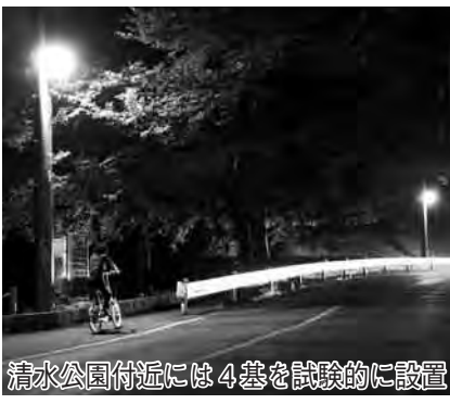
清水公園付近には4基を試験的に設置

◆LED式防犯灯 6月25日までに6か所20灯設置し、作物への影響などを調査研究しています。