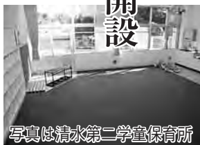
写真は清水第二学童保育所

ど詳しくはお問い合わせください。また、11月には、野田・柳沢・山崎の3か所に、平成23年4月には、南部・宮崎・みずきにも学童保育所を新設する予定です。