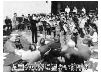
児童の演奏に温かい拍手が

同サロンは、毎月第1・3水曜日に3歳までの子と親、祖母が無料で利用でき、子育て中の親が気軽に集まってお互いの悩みを打ち明けたり、育児のこつを年配の方から教わるなど、世代間の交流にも役立っています。