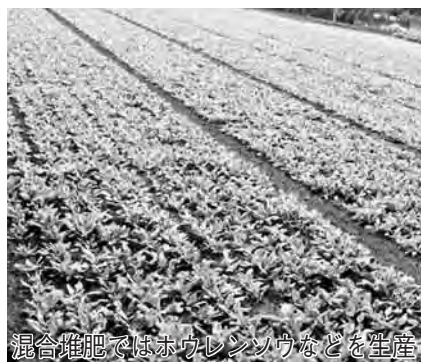
混合堆肥ではホウレンソウなどを生産

元気な稲を育てる効果が期待できる「玄米黒酢」を使用した「特別栽培米(ちばエコ米)」の生産に、船形・目吹・木野崎の田んぼ約220ヘクタールで取り組みました。