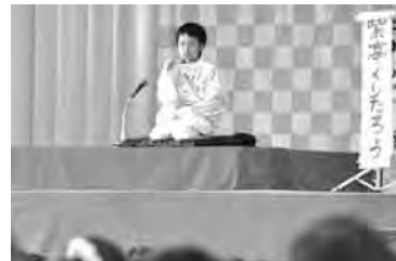
700人を超える“観客”を前に堂々と