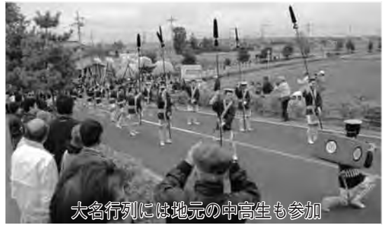
大名行列には地元の中高生も参加

関宿城まつり実行委員会では、関宿地域に伝わる郷土芸能や江戸時代の武術などを皆さんに楽しんでいただこうと、県立関宿城博物館周辺を会場に、平成8年から「関宿城まつり」を開催しています。