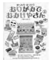
「おりがみでおみせやさん2」 いまいみさ・著 毎日新聞社

興風図書館 ☎7123-7611 南図書館 ☎7125-7981 北図書館 ☎7129-8811 せきやど図書館 ☎7198-4946