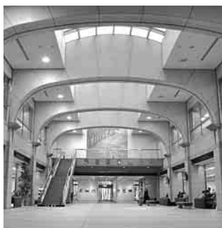
式典や壮行会なども開催

市役所の正面玄関を入ると、約400平方メートルの吹き抜けのエントランスホールが広がります。同ホールには、グランドピアノが備えてあり、平成5年の本庁舎完成時から、合唱や演奏などのサークル活動の発表や練習の場として、幅広い層の方に利用されています。 また、市の主催するリサイクルフェアや文化祭の菊展なども開催しています。 さらに、ホールと接して、絵画や写真のほか、押し花などを本格的に展示できる「ふれあいギ