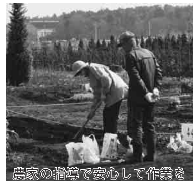
農家の指導で安心して作業を

農園では、農家の指導で、野菜や草花の栽培を行うことができますので、初めての方でも安心して農作物の栽培に取り組めます。