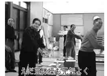
えだ豆体操も元気よく

の送付のほか、各地区ごとに、70歳以上の方が参加する「ふれあいの集い」を開催して、地元の方の踊りや演芸などを楽しみます。 新たな住民との交流も