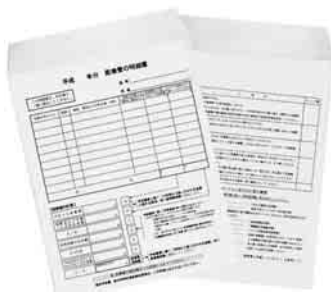
医療費控除の明細は事前にご記入を