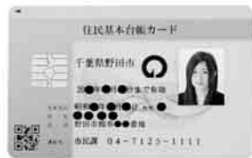
写真付きは銀行の口座開設にも

なお、インターネットを利用して、所得税の確定申告をする際には電子証明書付の住民基本台帳カードが必要です。