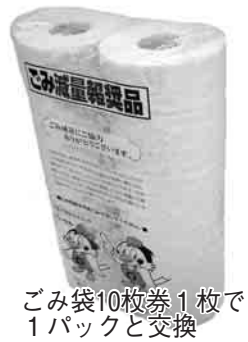
ごみ袋10枚券1枚で トイレットペーパー1パックと交換

めるため、市では、今年も指定ごみ袋引換券の残券を、トイレットペーパーに交換する還元事業を表の日程で行います。交換用のトイレットペーパーは、皆さんから資源として出された、古紙100パーセントの再生品です。