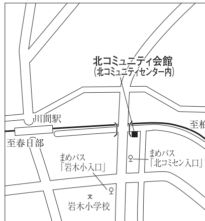
▶ 北コミュニティ会館 (北コミュニティセンター内)