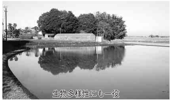
生物多様性にも一役

現在、市では地域の方の協力で木間ヶ瀬や関宿、船形などの9か所の水田に、冬でも田んぼに水を張る「冬期湛水」の試みを始めています。