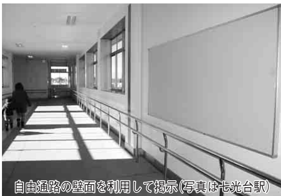
自由通路の壁面を利用して掲示(写真は七光台駅)

1か月単位から利用でき、企業の広告だけでなく、各種イベントの案内など、一般の方の利用も可能です。