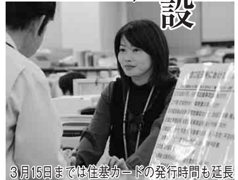
3月15日までは住基カードの発行時間も延長

市では、市民の皆さんの生活様式が多様化などに対応しようと、平成17年6月から、平日の市役所本庁の市民課窓口の業務時間を試行的に20時まで延長しましたが、さらに効率よくサービスを提供するため、20年7月からは、平日の時間延長を火・木曜日とする一方で、日曜日にも8時30分から17時15分まで同窓口を開設しました。また、転入出や確定申告にも便利な、電子証明書付の住民基本台帳カードの発行も3月15日までの火・木曜日に限り19時まで時間延長しています。