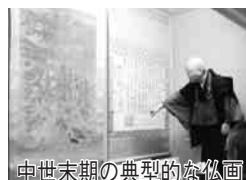
中世末期の典型的な仏画

「絹本著色釈迦涅槃図」の公開 2月11日(金)9時～16時 普門寺で。天文年間(約470年前)に制作