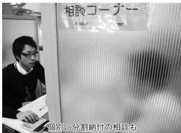
個別に分割納付の相談も