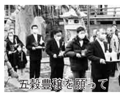
五穀豊穡を願って