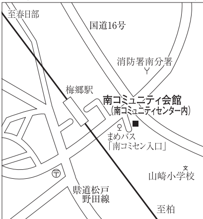
▶ 南コミュニティ会館 (南コミュニティセンター内)