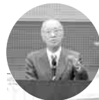
で賑わった特別展(写真下)の半藤氏(中)と講師(初日)と