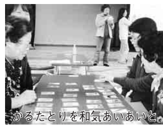
かるたとりを和気あいあいと

南部南地区は、平成7年に「地域ぐるみ福祉ネットワーク」として発足し、より地域のつながりを生かした活動に取り組もうと、12年11月に、「南部南地区社会福祉協議会」に移行しました。東新田・西新田・大崎・島・ライオンズガーデン梅郷の5自治会に、17年度からみずき地区も加わり、現在は約2千世帯で構成されています。