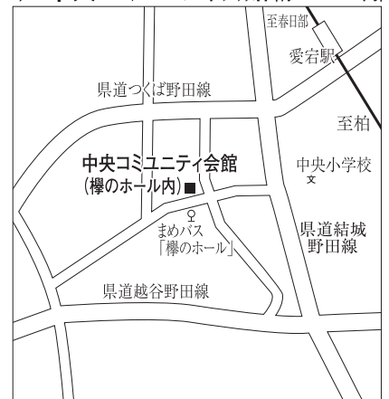
▶ 中央コミュニティ会館(櫻のホール内)