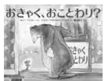
「おきゃく、おことわり?」 ボニー・バックー・著 岩崎書店

興風図書館 ☎7123-7611 南図書館 ☎7125-7981 北図書館 ☎7129-8811 せきやど図書館 ☎7198-4946