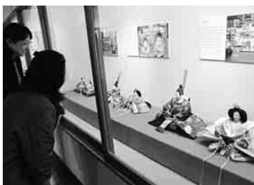
人形と撮った思い出の写真も

旅行先で見た「吊るしびな」を自ら作ったものや、初めての原稿料がわりにもらった人形など、48人から57点のひな人形や関連作品が並び、春を告げている。入館無料。火曜日休館。