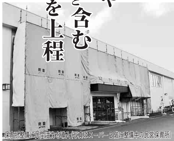
保育所整備に民間活力を導入(写真はスーパー2階に整備中の民営保育所)

◆議案第5号 公益的法人等への職員の派遣等に関する条例の一部を改正する条例の制定 千葉県市長会に職員を派遣するため所要の改正を行うとともに、派遣先の見直しにより規定を整備