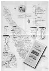
ルート図と時刻表を一枚に

合併時に新市の一体性をつくる事業として、平成16年1月から走り出した「まめバス」