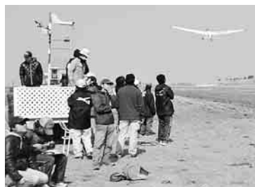
1時間2分で名古屋大学が優勝

思い出とともに 春告げる57点のひな人形 人形にまつわる思い出とともに、それぞれの家に伝わるひな人形の展示が郷土博物館で今年21日まで開催されている。