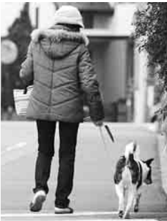
散歩時は必ずフンの始末を

としつけを行うことが大切です。 ◆ ペットを飼うときの注意点 最近、散歩中のフンの放置や放し飼い、深夜や早朝の鳴き声で眠れないなどの苦情が多く寄せられています。