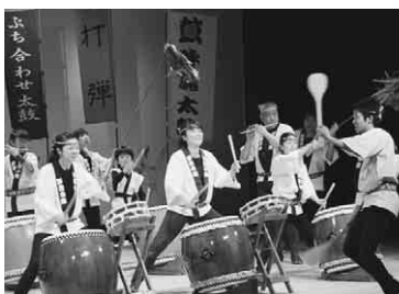
「呼魂太鼓」の皆さんの力強い演奏も

震災被災者を招き、大正琴、唄や踊りなどの披露のほか、福島県産米の紹介も。ハーモニカによる「故郷」の演奏では、来場者もふるさとに思いをはせて、優しい音色に歌声を重ねた。