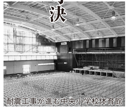
耐震工事が進む中央小学校体育館

第2回定例市議会は、2月29日から開催され、私有地を含む全市域の放射能除染や地域防災計画の見直しなどを含む新年度予算案や、学校耐震化事業を含む補正予算案、追加議案4件を含む33議案と議員発議4件を可決し、3月23日に閉会しました。