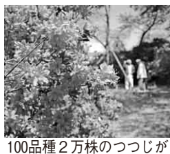
100品種2万株のつつじが

が無くならず、次第終了。抹茶と菓子付きの御茶席券300円 【筆曲演奏】第1部は11時、第2部は11時50分、第3部は13時、第4部は14時、第5部は15時から演奏開始 【問合せ】野田市観光協会 ☎7123-11085 (土・日・祝は☎7124-0143)