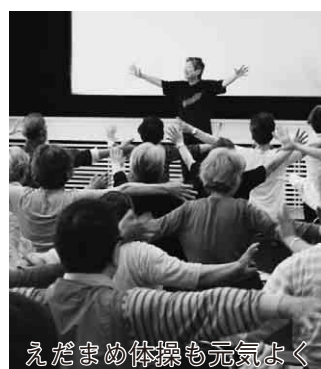
えだまめ体操も元気よく

市が独自に平成18年度から取り組んでいる「健康づくり推進プロジェクト事業」の6年間の成果や、24年度の事業紹介などを行う「健康づくり体感フェア2012」を開催します。