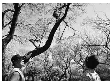
園内にはハクチョウやカモが集う池も

今年のは寒波や降雪の影響で、例年より一か月ほど遅い開花。梅の花が満開となった3月下旬には、写生や写真撮影、散策をする人など、それぞれ遅い春の訪れを楽しんでいた。