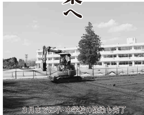
3月までに小・中学校の除染も完了

量の高い箇所があることなどから、私有地を含めた全市域を対象にした除染計画を策定しました。この計画は、市の負担が生じますが、皆さんの放射性物質への不安を解消し、特に市の将来を担う子どもたちが安心して住める環境を取り戻すため、国より厳しい市独自の基準で策定したもので、測定高5センチメートル、毎時0・23マイクロシーベルトを除染基準としています。