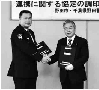
野田警察署長(左)と協定締結