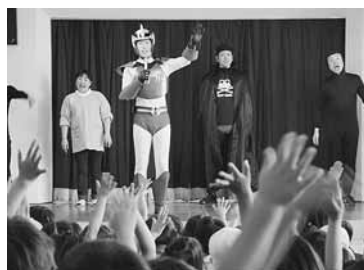
好き嫌いと元気に約束

子ども館の楽しさを親子で体験 市内に6か所ある子ども館では、活動内容を多くの人に知ってもらおうと、6月30日、桜の里公園で「移動子ども館」を開催。幼児から小学