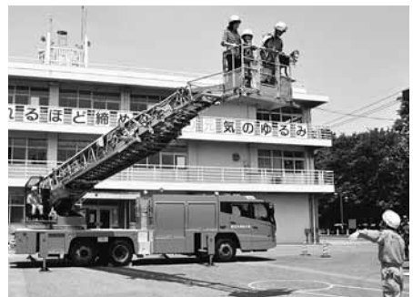
普段はなかなかできない体験を