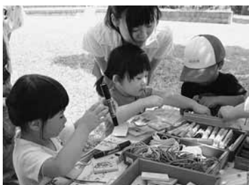
真剣な表情で工作に挑戦

6年生までの子と親子83人が集まった。子どもたちは、輪投げやフラフープ、知恵の輪づくりの工作など、出前子ども館の楽しさを暑さに忘れて元気いっぱい満喫していた。