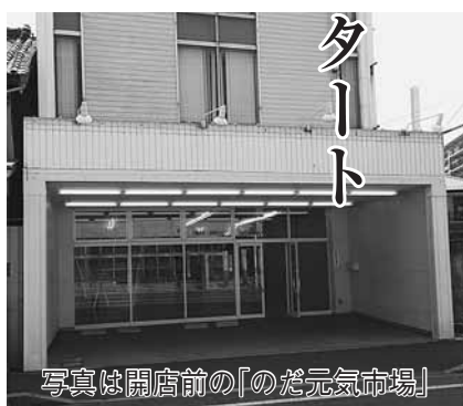
写真は開店前の「のだ元気市場」

市は事業者に移動販売車（2トン車）の購入費用を助成し、事業者が独立採算により運営することで、現在、事業者との協議を行っています。