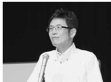
自分の心との付き合い方が大切とも

「怒りは自分への毒」という名越氏は、苛立ちや暗い気持ちになる人、周りを見下す人は、怒りを抑えて、さわやかな自分を作れば、自己の能力を存分に発揮できると語った。