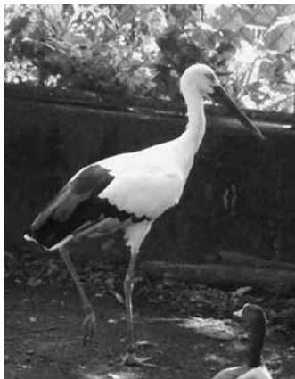
飼育を開始したコウノトリのオス(上)とメス

また、玄米黒酢を使った減農薬の米づくりや、冬でも田んぼに水を張るなど、環境に優しい農業を全市域に広げ、多くの生き物が生息できる地域環境作りにも取り組んでおり、市内のあちらこちらで、ホタルやドジョウをはじめ、多種多様な生き物が戻ってきています。