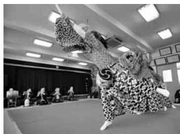
一時途絶えたが昭和45年ごろに復活

獅子舞が3時間に渡って披露された。当日は雨模様のため、場所を下根自治会館内に移し、四方固めの舞の後、12種類の棒剣術と勇壮な獅子舞が披露された。