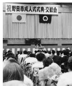
昨年度は1,034人が新成人に

なお、市外に住民登録のある方で、野田市成人式に出席を希望される方は、別途、お問い合わせください。