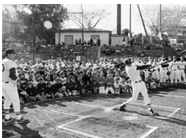
迫力の模範演技には歓声が

今年で10回目を迎えた同教室には、市内全域から約300人の中学生が参加。晩秋の青空の下、実技指導に加え昼食も一緒に楽しむなど、大学生との交流を深めていた。