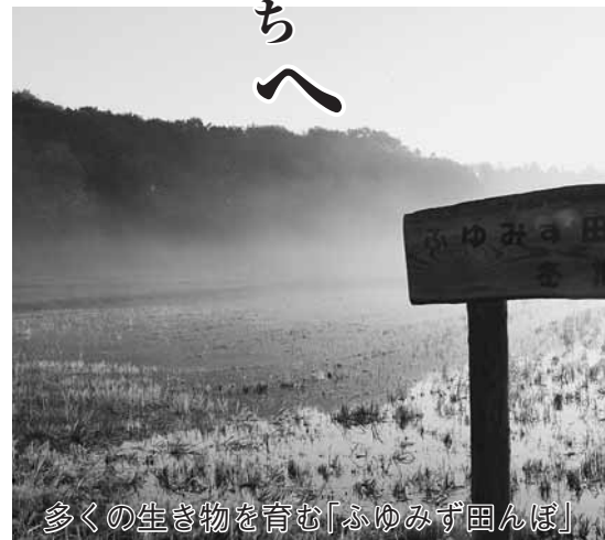
多くの生き物を育む「ふゆみず田んぼ」