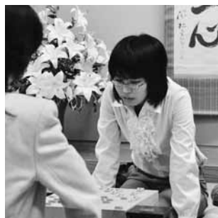
白熱の対局を間近で観戦

◆青色申告決算書・確定申告書の送付 本年の青色申告決算書は平成25年1月下旬に所得税の確定申告書と併せて送付(平成23年分の確定申告書をe-Taxか国税庁ホームページ「確定申告書等作成コーナー」を利用して提出した方は対象外)。申告書の用紙は国税庁ホームページ