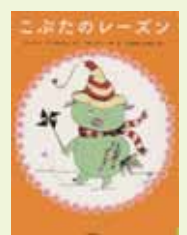
「こぶたのレーズン」 パーリント・アーグネシュ作 偕成社

興風図書館 ☎ 7123-7611 南図書館 ☎ 7125-7981 北図書館 ☎ 7129-8811 せきやと図書館 ☎ 7198-4946