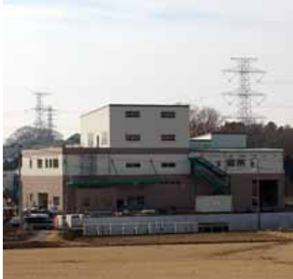
建設の進むリサイクルセンター

管理業務の委託事業者は、委託事業者選定審査委員会で公募型プロポーザル方式により極東開発工業株式会社に決定し、5年間の長期継続契約として、予定額8億7千885万円で10月29日に業務委託契約を締結しました。