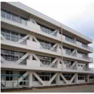
耐震化が完了した岩木小学校

なお、宮崎小学校は、教室棟全体の建物の耐震性は構造耐震指数の1s値が0.36ですが、エキスパンションジョイントで2棟に分かれているうちの1棟は、一部にコンクリート圧縮強度が低いため改築を行います。耐震補強工事は来年度に行い、改築を行う棟は、設計を来年度とし、改築工事を26年度から27年度までの継続事業として実施していきます。