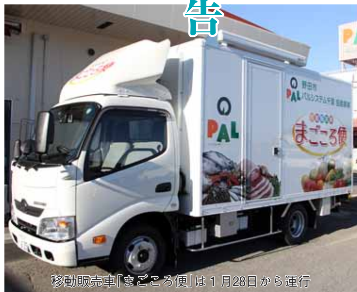
移動販売車「まごころ便」は1月28日から運行

整備した団体が38団体、要援護者登録者数は282人と、まだまだ少ない状況です。今後、説明会を実施していない地区に積極的に