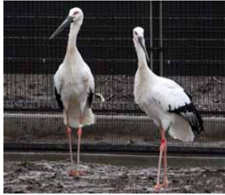
コウノトリは豊かな自然の象徴として

野田市が提案し、進めてきた生物多様性の取組をやつと国が認め、国の方針として進めることになりました。これを受け10月31日、代表幹事市である当市と役員