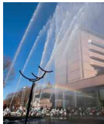
消防団による一斉放水