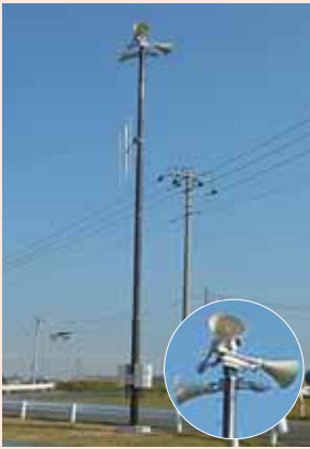
市内212か所に子局を設置

市では、緊急時に市民の皆さんに一齐に情報をお知らせする「同報系防災行政無線システム」の整備工事を進めています。すでに市役所親局の整備が終