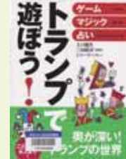
「トランプで遊ぼう!」 上口龍生、三田皓司、チャーリー・スー監修 池田書店

トランプ遊びには定番ゲームだけでなく、スリリングなゲームなど盛り上がる遊びが盛りだくさん。他にもマジックに占いもあり遊び方は自由自在。子どもから大人まで楽しむことができます。