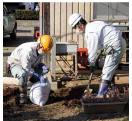
国より厳しい基準で宅地も除染

保育所2か所と福田地区の学校4校で行っている放射線の被ばく積算線量の計測は、10月31日時点までの積算値を基に想定年間積算線量を計算したところ、0.115から0.367ミリシーベルトまでで、年間1ミリシーベルトを超える施設はありませんでした。保育所やこだま学園、あさひ育成園、公立幼稚園、公立小中学校の給食食材検査は、10月より消費者庁から2台目の検査機器の貸与を受け、検査品目を増やすとともに認可外保育施設や私