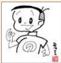
イラスト：岩瀬元巳

のイラスト入り複製、色紙(写真)をセットにしてプレゼントします。正解と応募者は、2月1日(日)で発表します。当選者の方は、氏名を紙面に掲載させていただきますので、あらかじめご了承ください。