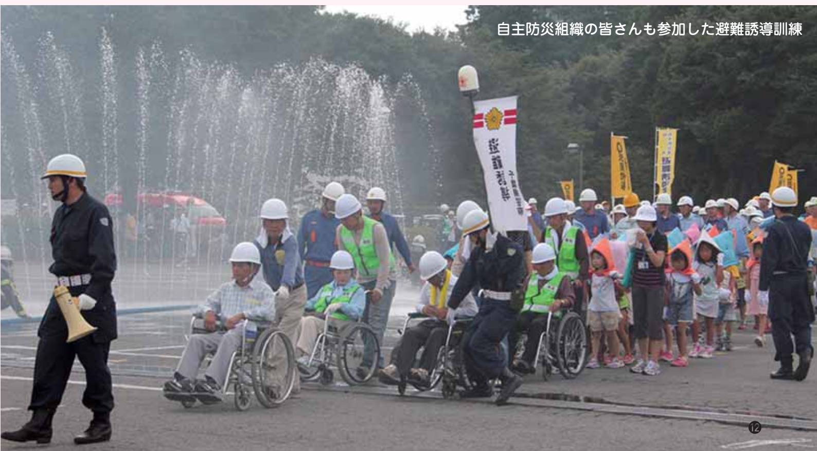
自主防災組織の皆さんも参加した避難誘導訓練

地域ぐるみで地域の安全を守る自主防災組織を自治会や地域ごとに結成しましょう。 市では、自主防災組織に、資材や機材の購入費や防災訓練の活動経費などに補助金を交付しています。