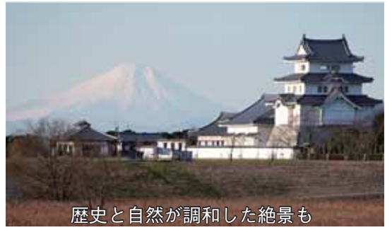
歴史と自然が調和した絶景も

野田市は、三方を河川に囲まれた地形から、堤防やその周囲では富士山を眺望できるポイントが数多く存在し、市内4か所が「野田市からの富士」として「関東の富士見100景」の1景に認定されています。