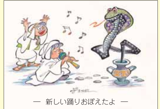
イラスト＝稲葉多太司さん(清水)

やシベリアなど寒い地方にもいます。古くから人間と関わりが多いため、蛇に関する故事やことわざもいろいろあります。あっても意味のないもの、余計なことを表す「蛇足」や、しなくてもよいことをしてかえってよくない結果になる「藪蛇」、藪をつついて蛇を出すのほか、「蛇穴を出づ」は冬眠していた蛇が春の訪れとともに這い出すことで、春の季語ともされます。社会にはいろいろな出来