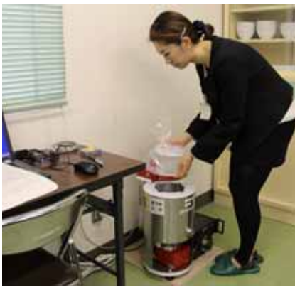
野菜や井戸水の市民持込検査を実施

域の平均が1キログラム当たり64ベクレル、中部地域で84、南部地域で26となっており、また、水田では、最低が北部地域で73、最高が南部地域で202、平均で124となっています。畑地は減少、水田は横ばいの傾向が見受けられます。