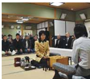
問近で対局観戦も（写真は昨年）