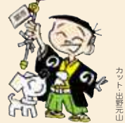
イラスト：岩瀬元巳

の3河川に囲まれています。④正月(羽をついたり、飾ったり)。⑤ワインの種類。白赤、——。⑦賞成。⑧ゆで、——あげ、——飯。⑫冬の風物詩。バケツの帽子にホウキの手。⑬正月遊びの——。顔を作ります。⑮人日の節句(1月7日)の朝に食べる——粥。⑰おでんにしたり、ブリと煮たり。⑱アジア原産の通気性に優れ伸縮性のない繊維。 【ヨコのカギ】①元日に国立競技場で決勝戦が行われる「——全日本サッカー選手権大会」。⑥日本では青森県と長野県で多く生産されています。⑦漢字で「櫛」。⑧奈良公園にいるオスは角のある動物。⑩「慣用語」。——をひそめる。⑬頑丈、強いさま。——「ガイ」。⑯俳句で「雪」「月」「花」などの言葉。⑰主に木造建造物の建築、修理を行う職人のこと。⑱悲しい時、——が頬を伝う。⑲——と答え。⑳ふりがな。——を振る。㉑ユーカリの葉を食べる動物。㉒西郷隆盛の出身とされる藩。㉓タラの芽、ウダ、ワラビ、ゼンマイなど。