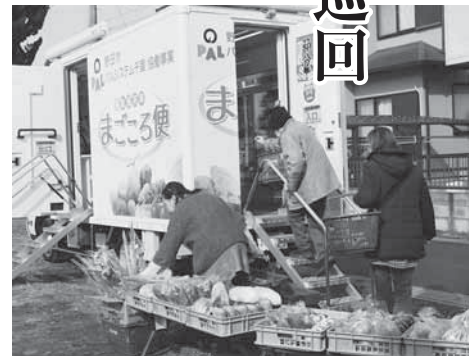
切り花や季節の品なども

民営の買物便利拠点「のだ元気市場」を開設し、生鮮食料品や惣菜などを提供しています。