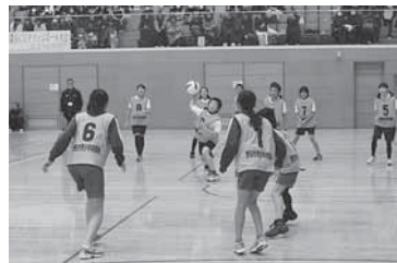
勝利に向けて気合の一投