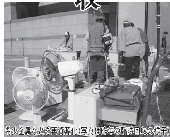
希少金属などを再資源化(写真は昨年の臨時回収の様子)

【問合せ】清掃計画課 なお、回収日は、資源物（紙類、びん、衣類、布、金属類、ペットボトル）の受け入れもを行いますので、品目ごとに分類してから持ってきてください。