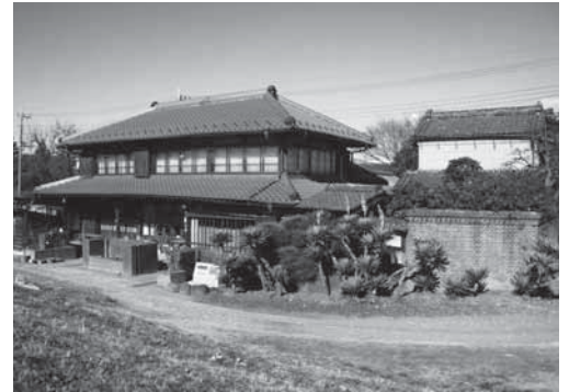
河岸問屋の面影を残す主屋(左の建物)

便鉄道の開通や関東大震災後の自動車輸送の普及により、昭和13(1938)年に終わりを告げます。