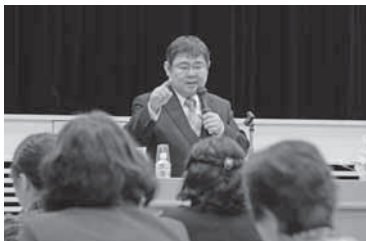
児童相談の件数は10年で10倍に

子育てなどの不安や心配を軽減しようと、市では2月3日、市役所8階大会議室で「心のケア」講演会を開催した。