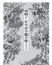
「決戦! どうぶつ関ヶ原」 コマヤスカン・作 講談社

興風図書館☎7123-7611 南図書館☎7125-7981 北図書館☎7129-8811 せきやど図書館☎7198-4946