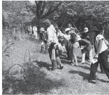
市内の公園や河川敷で野草を観察

なかよし自然隊は、平成12年に、関宿町で動植物の観察や調査をしようと結成されたボランティア団体で、当初は、5人程度で地道に活動していました。