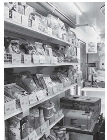
要望の多い商品を中心に