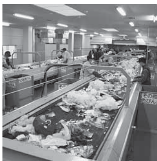
手選別ラインで資源物を選別

平成21年度末に稼働を停止した三ツ堀の不燃物処理施設に代わる新たな施設として、目吹に建設を進めてきた「野田市リサイクルセンター」が3月18日から本稼働します。 敷地面積は1万1千642・15平方メートル、建物は地上3階建て、延床面積は4千653・5平方メートルで、1日に不燃ごみ31トン、不燃粗大ごみ1トンの計32トンの処理が可能です。 また、収集されたごみの中から資源物を手作業で取り出す手選別ラインは、前施設より1本