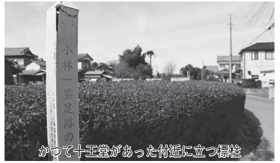
かつて十王堂があった付近に立つ標柱

今から約200年ほど前の文化9(1812)年3月2日、俳人・小林一茶が野田の地を訪れました。