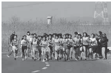
学校やクラブチームから大勢参加

関宿城博物館周辺河川敷特設コースで、恒例の関宿城マラソン大会が、市体育協会や市教育委員会などにより、2月3日、開催された。 就学前の子どもと1キロを走る親子クラスから始まり、15クラスに921人が参加。 強い向かい風の吹く中、沿道からの暖かい声援を受けながら、各クラスとも激しい熱戦が繰り広げられた。