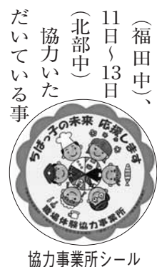
協力事業所シール

市では、平成17年度から中学2年生を対象に、将来自分のなりたい職業の選択の幅を広げてもらおうと、職場体験学習を行っています。