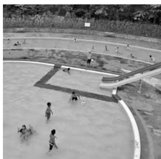
流水プールや子ども用プールなど

また、入場11回分が6千800円(中学生以下は2千700円)の回数券(購入年度内有効)も販売しています。