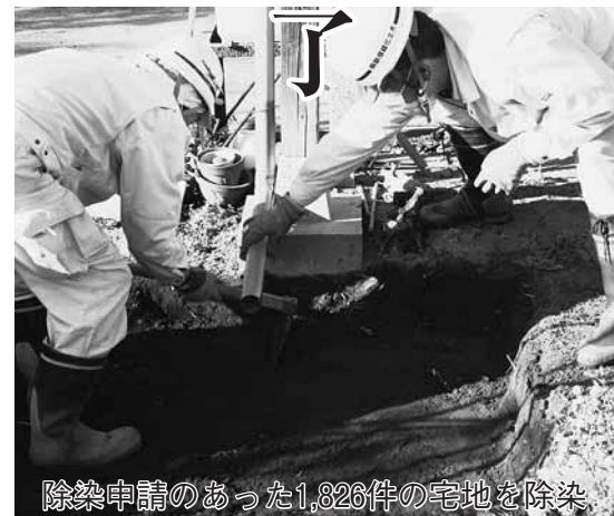
除染申請のあった1,826件の宅地を除染

終了し、国の基準を超えたものが15件、市の基準を超えたものが2千754件ありました。市の基準を超え、除染申請のあった千826件のうち、千823件は、24年度中に除染を完了しました。