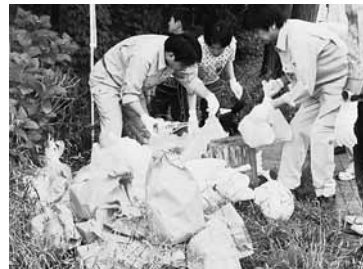
みんなで街や堤防周辺をゴミ拾い

自治会や子ども会、企業など101団体、約2,200人が参加し、街を「大掃除」。空き缶や紙くずなど、拾ったゴミは2トントラックで約1台分（1千600キログラム）の重さにもなった。