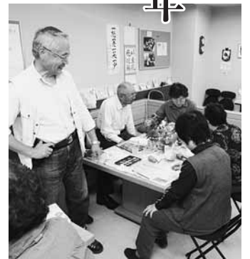
間や相談相手をつくれる場にもなっています。

また、ボランティアの方の協力で、童謡を歌ったり、ストレッチ体操や書道、手芸などのレクリエーションが行われたりと、楽しい雰囲気の中で、「気軽に、無理なく、楽しく」同世代の仲