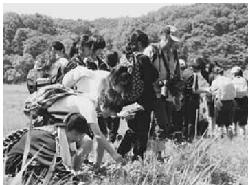
手にとってセリやヘビイチゴなど観察

高校の先生や自然保護団体の方などの解説を聞きながら、生徒たちは初めて見る野鳥や魚、植物などを熱心に記録。希少な自然を大切にしたい」と話していた。