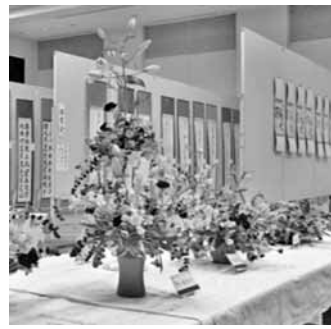
日ごろの活動の成果を

4日回／舞台発表…文化会館 11月2日回、3日回、4日回、9日回、10日回。櫻のホール11