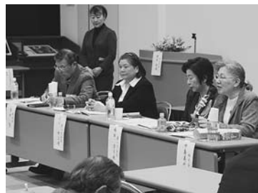
歴代会長が同会の歩みも紹介

身近な材料で手軽にできる和菓子作り 関宿中央公民館では、和菓子で季節を感じてもらおうと、3月27日に「春の和菓子作り教室」を開催し、男女各4人が参加した。