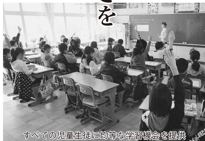
すべての児童生徒に均等な学習機会を提供