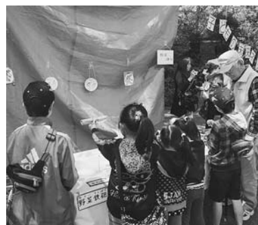
工作などの体験コーナーも