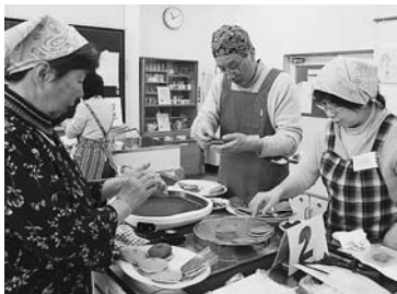
つぶあんを挟んでサクラの焼印も

13日のさくら餅作りに続いて2回目のこの日は、どら焼き作りに挑戦。小麦粉や卵、ハチミツなどを混ぜて作った生地がふんわりと焼きあがると、甘い匂いが会場を包み込んだ。