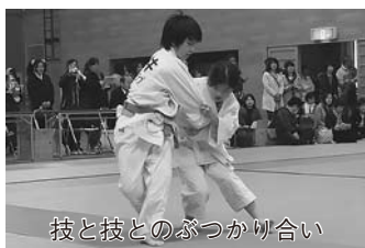
技と技とのぶつかり合い

4月20日(日)9時30分から総合公園体育館で。クラス別に個人戦と団体戦。観戦自由。園青少年課☎青少年課