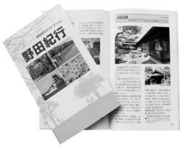
野田市の見どころが一冊に