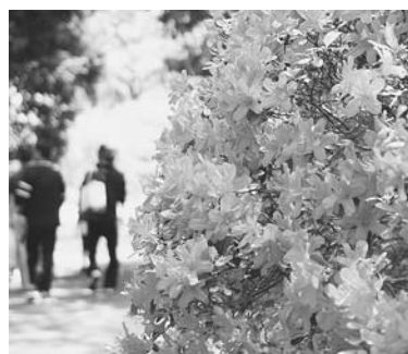
100品種約2万株のつつじが

毎年恒例の「つつじまつり」が4月19日(土)から5月6日(火)まで、清水公園を会場に開催されます。 まつり期間中の開花状況は、野田市観光協会のホームページ( http://www.kanko-nodacity.jp )で確認できます。 また、同協会では、5月3日(土)(雨天の場合は5月4日(日)に延期)に清水公園第一公園広場の野点・箏曲演奏会を開催します。 【野点】10時～15時30分(お菓子が無くなり次第終了)。抹茶と菓子付きの御茶席券大人300円(子ども200円)