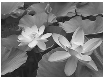
2千年以上前の花の姿が今も

平成10年に千葉市から11株を譲り受けたのが始まり。昭和26年に種子を発掘した博士の名を持つこの古代ハスは、例年、約30株から直径20センチほどの大輪を次々と咲かせている。