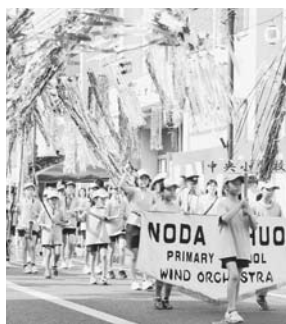
地元校の吹奏楽部も登場