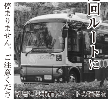
利用には事前にルートの確認を

夏まつり期間中、まめバスは10時から終車まで迂回運行し、迂回ルート内にバス停があっても