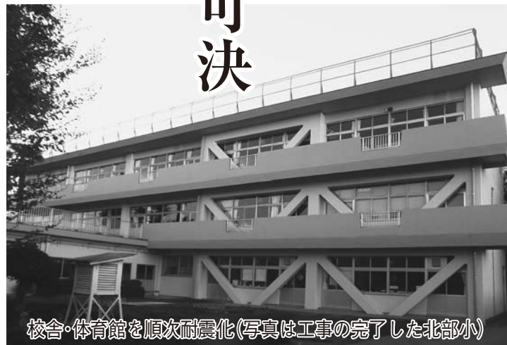
校舎・体育館を順次耐震化(写真は工事の完了した北部小)

自然共生ファームの経営状況／野田市民保護計画の変更／専決処分の報告(7件) 《認》 専決処分の承認(2件) 《可決された議案》