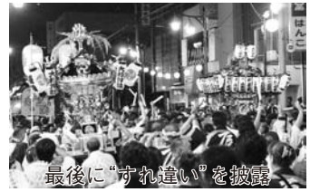
最後に「すれ違い」を披露

〔愛宕駅〕下車徒歩約5分)で雨天決行。15時30分から子どもこし、17時10分から市内各地域の