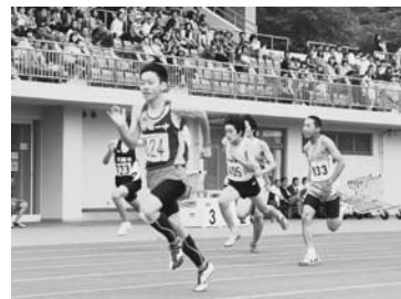
スタンドからは万雷の拍手と声援

トルで大会記録が9年ぶりに更新されたのを皮切りに、4種目で大会新記録が樹立された。各選手がしのぎを削り、南部中学校が7年ぶりに総合優勝に輝いた。