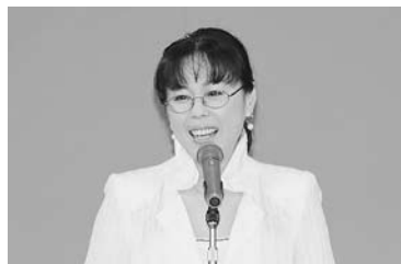
周囲の支えも大切と話す高部さん

犯罪や非行のない社会を目指す「社会を明るくする運動」野田地区推進委員会は、興風会館で7月5日、女優で精神保健福祉士の高部知子さんによる講演会などを行った。