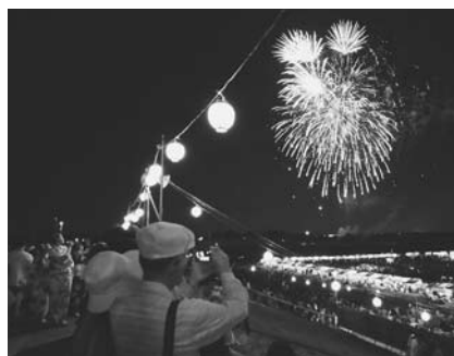
個人や企業による記念花火も