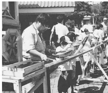
「遊びの広場」では流しそうめんも体験

「子どもの未来ネットワーク野田」は、平成11年に地元企業の呼びかけがきっかけで、主に子どもの育成活動に関わる団体や個人が集まって結成しました。