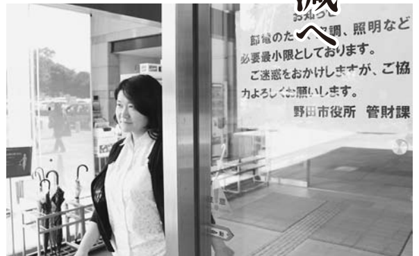
庁舎の冷房温度は今夏も28度設定に

市は、平成19年度に策定した「野田市地球温暖化対策実行計画」の期間満了に伴い、24年8月に新計画を策定し、温室効果ガス排出量の削減に取り組んでいます。25年度の排出量は、基準年度とした23年度と比べ、二酸化炭素換算で千700トンの削減となり、実行計画の目標値を達成できました。しかし、項目別では、まだ達成できていない部分もあるため、今後もさらなる取り組みを続けていきます。