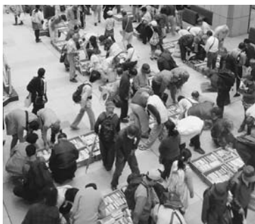
毎年人気の古本市