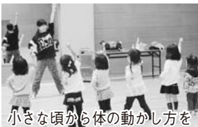
小さな頃から体の動かし方を