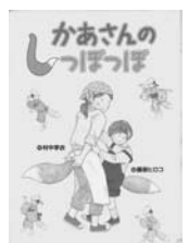
「かあさんのしっぽっぽ」 村中李衣・作 藤原ヒロコ・絵 BL出版

興風図書館 ☎7123-7611 南図書館 ☎7125-7981 北図書館 ☎7129-8811 せきやど図書館 ☎7198-4946