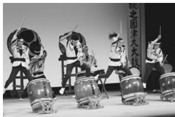
「シンプルに力強く」をテーマに

創作太鼓の演奏グループである下総之國津久太鼓響が、6月29日に櫻のホール・小ホールで活動20周年を記念する演奏会を開催した。