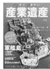
「今すぐ行きたい! 産業遺産」 小野崎敏・監修 竹書房

世界遺産登録が決まった富岡製糸場と絹産業遺産群を含め、現在も稼働中のものから役目を終えたものまで、今注目されている日本各地の産業遺産の歴史とその見どころを紹介します。