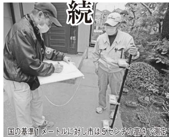
国の基準1メートルに対し市は5センチの高さで測定