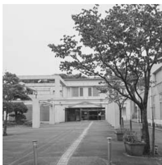
平成元年オープン of の2階建て施設

発表会などに利用できるほか、客席部分は、バドミントンや卓球、リズムダンスなどの軽スポーツなどにも使うことが可能です。南図書館は、約7万8千冊の蔵書数があり、土曜日には、幼児や小学生対象のおはなし会を行っています。休館日は、火曜日(祝