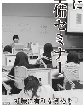
就職に有利な資格を

市は、ひとり親家庭の母・父・寡婦を対象に、ワード・エクセルの資格取得を目指す「就業支援パソコン講習会」と就職活動に必要な知識を習得する「就職準備セミナー」を実施します。