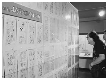
ダイちゃん ダイちゃん の原画約300枚がずらり

ダイちゃん ダイちゃん や、消防署中央分署の壁に描かれた「アタゴオル」など野田にゆかりの作品を一堂に展示。ポスターや商店広告にも利用されるなど、まちとの深い関わりも紹介している。