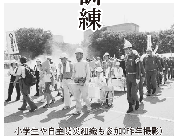
小学生や自主防災組織も参加（昨年撮影）

具体的には、高校生や小学生が障がい者団体の皆さんを支援し避難誘導する訓練や、炊き出し訓練、煙体験訓練を行うほか、まめメールの登録相談や給水車からの受給方法などの説明コーナーも設置します。