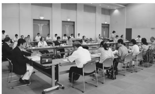
シルバープラン推進等委員会の会議の様子

市は、市民の皆さんに市政に直接参加していただくことと、平成24年4月20日に策定した「審