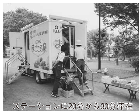
ステーションに20分から30分滞在