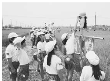
個性豊かなかかしが18体

野田のまちに息づく 漫画文化を再発見 郷土博物館では、9月23日まで特別展「野田で生まれた漫画たち」を開催している。市報に46年間連載した4コマ漫画「のだっこダイちゃん」や、消防署中央分署の壁に描かれた「アタゴオル」など野田にゆかりの作品を一堂に展示。ポスターや商店広告にも利用されるなど、まちとの深い関わりも紹介している。