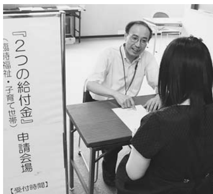
郵送のほか市役所8階で受付

◆水痘と高齢者の肺炎球菌予防接種 定期接種化に伴い、水痘は、生後12月から36月未満までの幼児が対象で、経過措置で生後36月から60月未満までの幼児が本年度に限り対象となります。