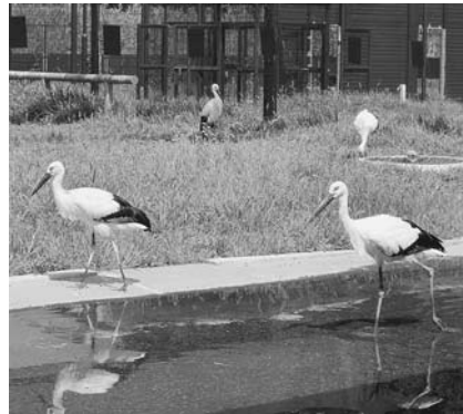
野田市生まれの幼鳥が同じケージに

◆コウノトリの繁殖 産卵、孵化、巣立ちと今年も順調に推移してきました。小ケージは飼育スペースとして狭く、フェンス等への衝突の危険性が高いと判断し、7月に3羽の幼鳥を大ケージへ移動させました。昨年誕生した2羽とともに野田市生まれの5羽が同じケージで過ごしています。今年生まれた幼鳥1羽が施設内で衝突し8月17日に死亡しました。衝突防止ネット設置などを行っていましたが、事故を受け、観察棟のガラス面にシールを貼るなどの対策を行いました。関東におけるコウノトリの野生復帰実現に向け、27年度の試