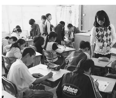
学力向上に向け土曜授業を実施

「土曜授業は学力向上に役立 つか」という質問で、前回の結 果と今回とを比較すると、肯定 的な回答は小学生が67パーセン トから64パーセントに、中学生 が72パーセントから54パーセン トに、保護者が84パーセントか ら71パーセントにと後退してお り、教職員は41パーセントから 40パーセントと横ばいでした。