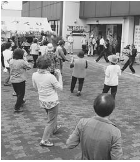
えだまめ体操で健やかに

◆レントゲンによる骨密度測定 保健センターでは、当日10時から正午まで(午前の部)と13時