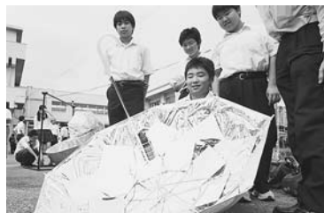
傘やくす玉にアルミや鏡を使い集光を工夫

太陽熱を使った調理の器具やレシピなどを競う「ソーラークッカーグランプリ第1回野田市内ジュニア大会」が9月6日、県立清水高校で開催された。 市内の中学や高校などから14組が参加。曇天で湯沸かし競技のみとなったが、90分間で91度を記録した県立野田中央高校のチームが優勝を飾り、2位は77度の第一中学校だった。