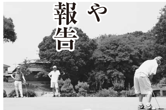
パブリックゴルフ場は安定した経営をめざして