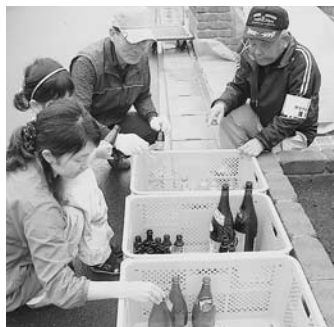
リサイクルを進める資源回収

私たちが日常生活を送る中で、 ごみ出しルールの徹底や防犯・ 防災活動、さらには地震や洪水、 火事などの災害が発生した場合 における避難行動要支援者の避 難支援や緊急活動など、行政だ けでは対応しきれない問題が数 多くあり、こうした時に必要と なるのがご近所同士の協力です。