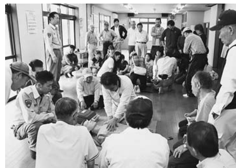
市消防と連携した防災訓練も