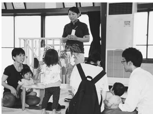
エンゼルプランは市の子育て支援の指針として

なお、子ども子育て関連3法 に基づき、市町村の条例で定め る「特定教育・保育施設及び特 定地域型保育事業の運営に関す る基準」「家庭的保育事業等の設 備及び運営に関する基準」「放課 後児童健全育成事業の設備及び 運営に関する基準」について、パ ブリック・コメント手続を経て 答申を頂きました。今議会に関 係条例案を提案しています。