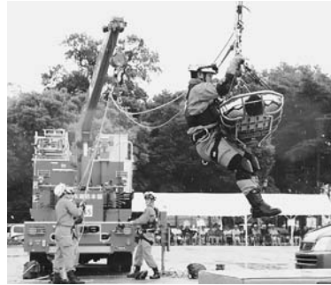
本番さながらの救出救護訓練

市は、毎年9月1日の「防災の日」に、関係機関や市民の皆さんと連携し、文化センター駐車場で総合防災訓練を実施しています。今年も、新地域防災計画で想