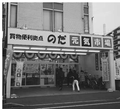
閉店後の活用を検討

からの集客を実験的に実施する案を市が提案し、8月に野田市商店街連合会を実施主体に補助金を申請しました。1月の事業実施に向け、商店街連合会、商工会議所、市が連携していきます。また、中心市街地への特別養護老人ホーム整備のあり方検討会での意見を踏まえ、シルバースロン設置などの活用策を検討していきます。