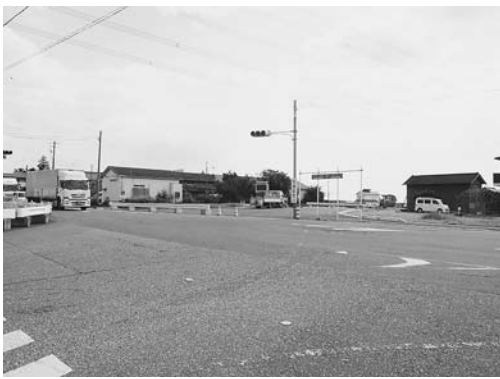
新設道路の波及効果を想定し都市計画を見直し

◆都市計画の見直し 本年度から2か年で県内一斉の見直しが行われます。県は、圏央道等の波及効果で新たな産業集積を図り、地域を活性化するための基本的な方向を示しました。これを受け関宿地域の用途地域等を見直す考えです。圏央道の五霞インターから2キロ、境古河インターから5キロの距離に位置し、特に境杉戸バイパスが完成すれば、物流、業務機能等を備えた新しいまちづくりも考えられます。また、五霞インターから半径