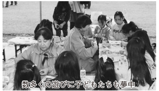
数多くの遊びに子どもたちも夢中

今年で36回目となる「野田市こどもまつり」は、「子どもたちによりよい遊びと創造の文化を。みんなで子どもたちを守り、健全な地域社会をつくろう」という趣旨から、野田市こどもまつり実行委員会が毎年開催しています。