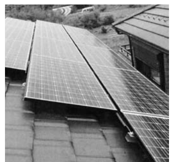
屋根に設置した太陽電池パネル