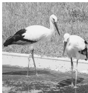
2羽に親しみのある愛称を