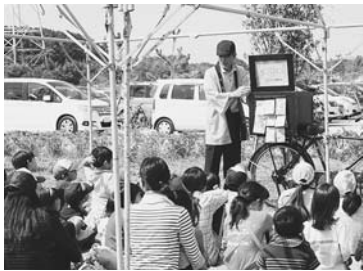
親子で楽しめる紙芝居などのイベントも

手作業で行って収穫した新米をうれしそ うに受け取っていた。 また、会場では、新 米のおにぎり販売や、 稲わらを使った工作 教室なども行われ、 家族全員で楽しいひと 時を過ごしていた。