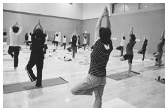
伸び伸びと適度な運動を

① バランスボール教室：10月29日～11月19日の毎週13時～15時50分。② ダイエットヨガ：10月29日～11月19日の毎週14時～15時。③ バドミントンサークル：10月30日～11月20日の毎週19時～21時。いずれも全4回。20歳以上。10人（抽選）。①②は2千500円。③は千500円。①はボール（貸出可）、②はマット、③はラケット持参。申込みは①②は10月26日、③は28日必着で電話か往復はがき（住所・氏名・ふりがな・年齢・☎を明記・1家族1通）で、〒270-1022 5平井401 関宿総合公園体育館 ☎719818