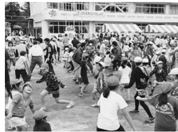
みんなでよさこい踊りも

江川地区の市民農園 自ら育てた新米で収穫祭 自然再生に取り組む江川地区の市民農園で 9月28日、収穫祭が行われた。参加者は、4月 に自ら田植えをし、草取りや稲刈りをすべて