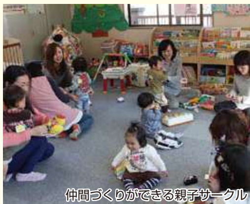
仲間づくりができる親子サークル

7か所のうち、3か所の地域子育て支援センターは、子どもが自由におもちゃで遊んだり、保護者同士が和やかな雰囲気の中で情報交換がで