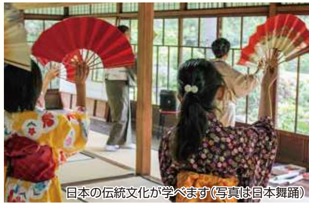
日本の伝統文化が学べます(写真は日本舞踊)

学校と地域が連携して 市は、平成14年から、「地域の子どもは地域で育てる」の考えのもと、地域と学校が協力して授業を作る「地域教育プラットフォーム事業」の取り組みを進めています。現在、11中学校すべてに地域教育の拠点を置き、地域教育コーディネーターの皆さんが子どもたちに、よ