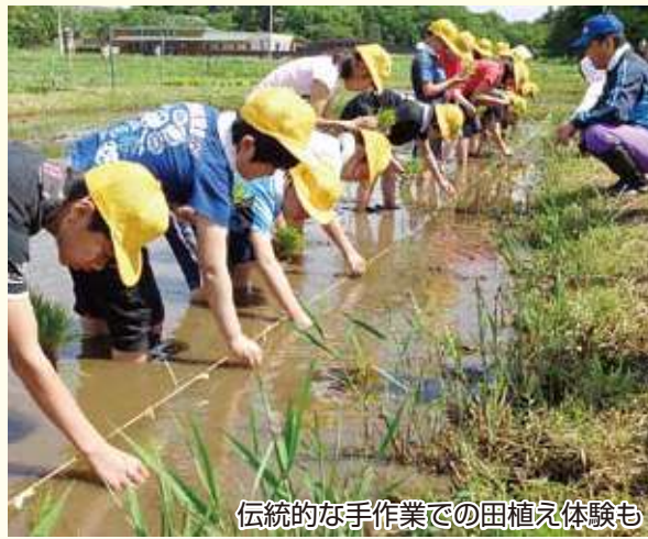
伝統的な手作業での田植え体験も

「地域の子は地域で育てる」という考えのもと、市は地域と学校が連携・協力して、キャリア教育や体験型学習を行う「地域教育プラットフォーム事業」を行ってきました。さらに、子どもたちに学ぶ楽しさをより感じてもらうと、昨年4月に「土曜授業」を開始しました。