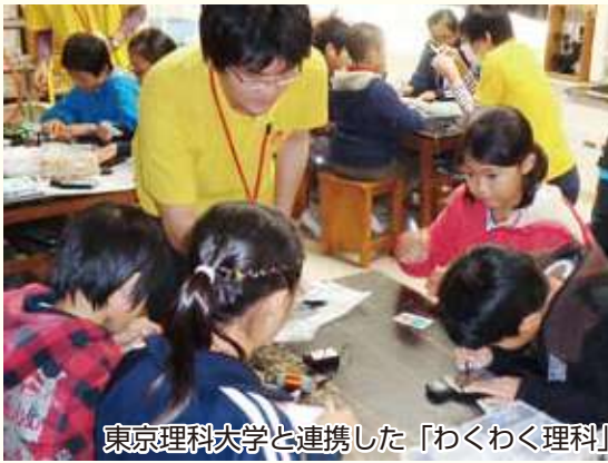
東京理科大学と連携した「わくわく理科」

ほかにも、無料でキャンプなどを楽しめる閑宿あおぞら広場や、スポーツ活動の拠点となる総合公園、閑宿総合公園など、市では、子どもが自然に触れ合えるさまざまな憩いの場を用意しています。