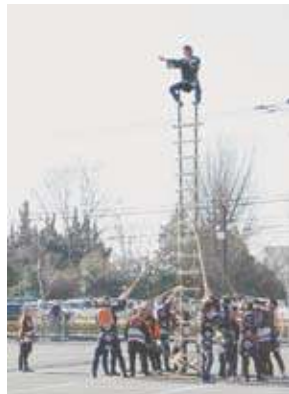
伝統のはしご乗りの披露も

消防出初式を文化センター駐車場などで行います。当日は7時にサイレンが鳴りますので、火災と間違えないよう注意してください。