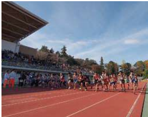
引き続き日本陸上競技連盟第3種公認へ向け改修

から28年度までの3期に分割して改修を行いたいと考え、26年度はトラックとフィールド内のウレタン等改修を予定し、1月4日から3月15日まで休場します。