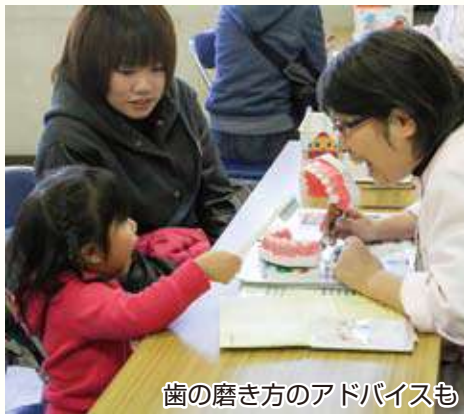
歯の磨き方のアドバイスも