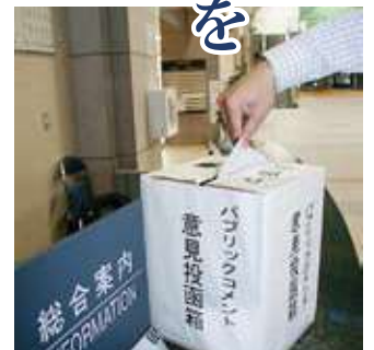
投函箱は市役所やいちいのホールにも

そこで、現在、策定作業を進めている左表の11の計画や条例に皆さんの意見を募集します。