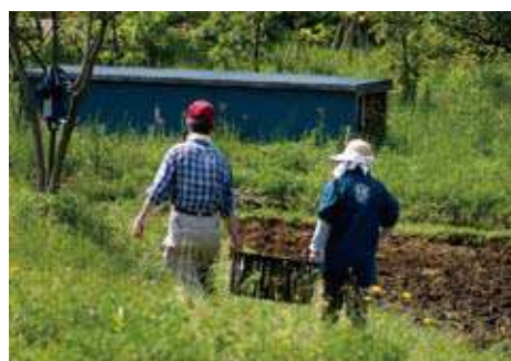
希望者に土の温もりと農家に担い手を

市は、「労働力を提供して欲しい農家」と、「農業に関心を持ち、農家で働きたい人」が短期間労働(パート)を基本に、お互いの条件に合った雇用契約を結ぶた