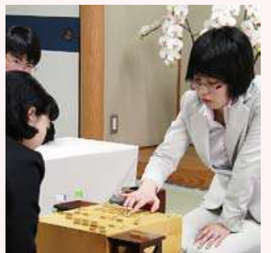
大盤解説会の参加者は対局観戦も