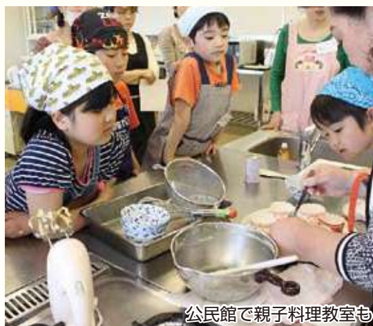
公民館で親子料理教室も

保護者を対象とした家庭教育学級のほか、小学生には、夏休み期間中の自習の場を提供する「子どもの学び舎」などを開催しています。