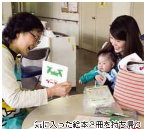
気に入った絵本2冊を持ち帰り

3か月児健康診査の際には、健診終了後に絵本2冊が入ったブックスタートバッグをお渡しし、ボランティアが保護者に読み聞かせ方や本の