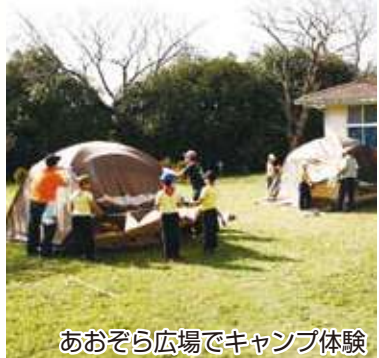
あおぞら広場でキャンプ体験

三ツ堀里山自然園は、散策や自然観察が楽しめる自然体験型の公園です。池や水路も整備し、植物や昆虫、魚など、たくさんの動植物を観察で