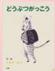
「どうぶつがっこう」トビイ・ルツ・作・絵 PHP 研究所

興風図書館 ☎7123-7611 南図書館 ☎7125-7981 北図書館 ☎7129-8811 せきやと図書館 ☎7198-4946