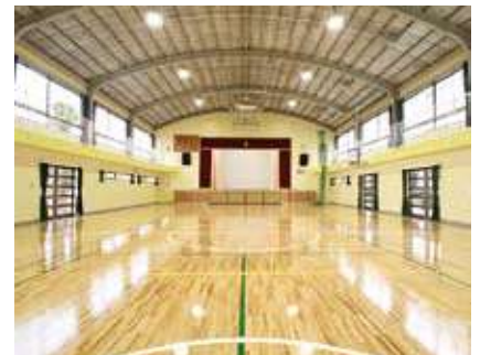
耐震化が完了した福田二小体育館

27年度予定の10棟のうち、清水台小校舎、木間ヶ瀬小校舎、二川中校舎の3棟は、再診断の結果、耐震補強工事が不要となりました。なお、二川小の木造校舎2棟と関宿南部幼稚園の木造園舎1棟は、耐震診断の結果、それぞれ木造構造耐震判定指標を下回り、今後の対応を検討していきます。