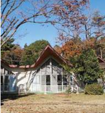
指定管理に移行する「こだま学園」

平成27年度から新たに導入するこだま学園とあさひ育成園は、社会福祉法人はーとふるを随意