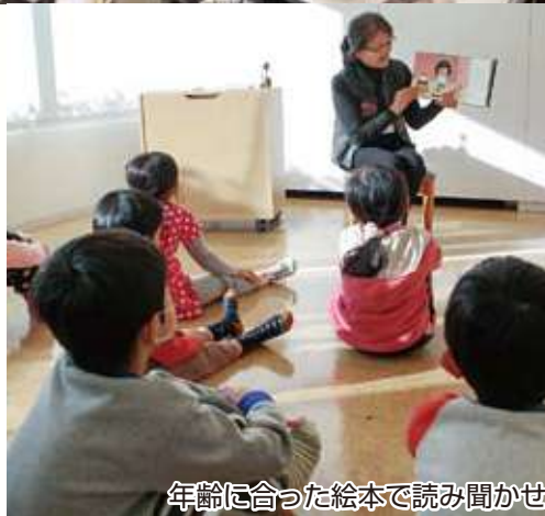
年齢に合った絵本で読み聞かせ

また、科学遊びや工作教室などのイベントも開催しており、昨年4月には興風図書館が、子どもの読書活動優秀実践校・図書館・団体（個人）の文部科学大臣表彰を受賞しました。興風図書館で定期的に行われている科学遊び教室では、身近な材料を