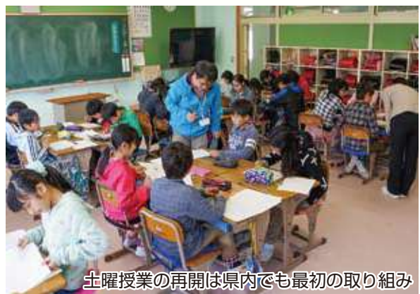
土曜授業の再開は県内でも最初の取り組み

国語や算数、数学を中心に通常の形の授業を行っているほか、教師や地域の方々の協力による土曜授業アシスタントが、児童・生徒の実態に合わせて補習やチーム・ティーチ