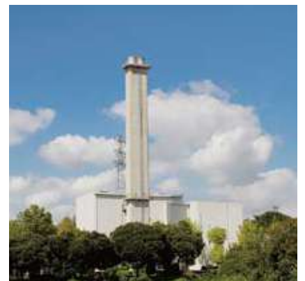
ごみ減量へ事業系ごみの受入指導を強化

◆ ごみ減量対策 10月9日の廃棄物減量等推進審議会で、悪質な排出事業者や収集許可業者に受入拒否等を行えることとし、手数料を見直し、10