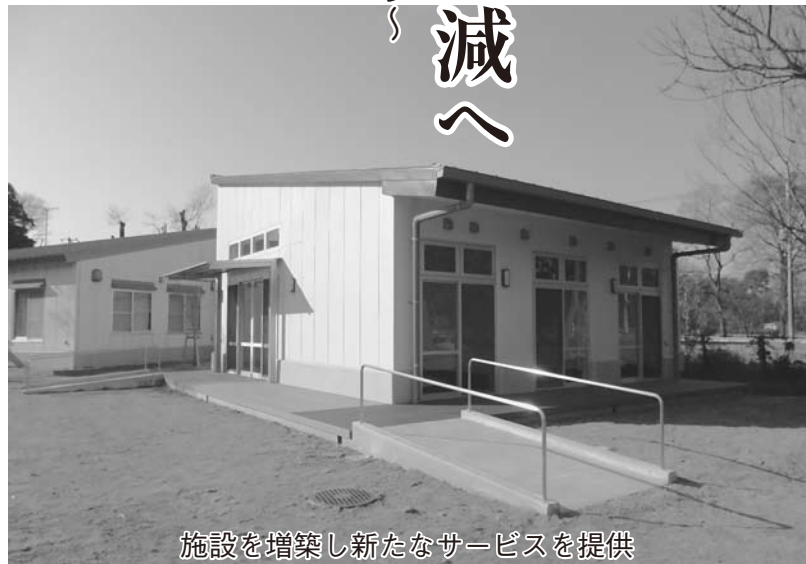
施設を増築し新たなサービスを提供

【問合せ】利用申請やサービス内容のことは社会福祉課、利用予約のことはあおい空 ☎7121-3741