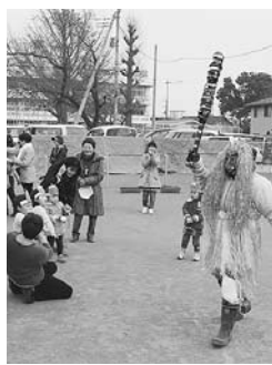
勇気を出して「鬼は外」