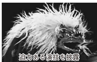
迫力ある演技を披露

地域子育て支援センターで。壊 れたおもちゃの修理。部品代は 実費負担。当日会場受付。関本 田 ☎712917495 ◆文化会館自主文化事業「グッ ドイヤーコンサートあったかい 生音」 1月25日回13時～17時櫻 のホール・小ホールで。アマチュ アグループによるフォークソング コンサート。全席自由。500円。 前売り券は文化会館、櫻のホー ル3階総合カウンター、ブック スエンドウ川問店で発売中。関 文化会館 ☎712411555 ◆野田和力祭り「春風に舞い幸 福を奏でる」 2月1日回14時～ 16時櫻のホール・小ホールで。 和太鼓や篠笛、津軽三味線、舞 を世界的演者の和力が披露。先 着300人。前売り2千円(当日2 千500円)、高校生以下500円(当日 同額)。前売 りは野田公 民館 ☎71 23178 19(電話 申込み可)、 文化会館で 発売中。 ◆フラダンス体験レッスン 2 月3日、10日、17日の回19時～ 21時中央コミュニティ会館(櫻