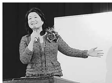
長寿社会には地域との絆が大切とも

講演では、検事や大臣秘書官時代に、結婚や出産で職場から退職を勧められた際に、家族の支えで仕事が続けられたなど、女性が社会で活躍するには周囲の支援環境が重要と語られた。