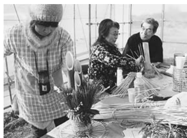
ロウバイやマンリョウで彩りも

空き缶の芯に稲わらや松などを飾り、高さ30センチほどの門松が約3時間で完成。参加した11人からは、「小さくても立派な門松ができた」「さっそく玄関に飾ります」などの声が聞かれた。