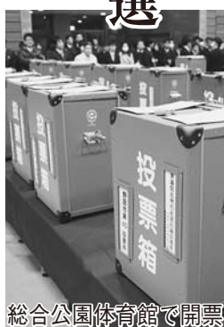
総合公園体育館で開票