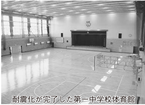
耐震化が完了した第一中学校体育館

今年度の学校耐震化工事が完了…… 1面 行政改革大綱などの素案にご意見を…… 2面 市・県民税の申告はお早めに… 4～6面 15万人のひろば…… 8～9面 おしらせ…… 12～13面 2月の相談日・休日当番医…… 16面