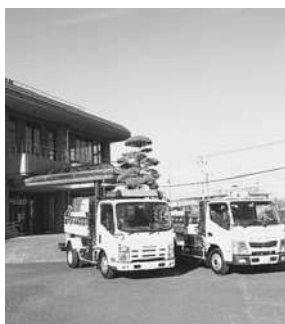
災害時に備えて給水車の配備も

水道は、皆さんの生活に不可欠なライフラインで、水道部はその水道施設の維持や運転管理などを行っており、水道法に基づく水質検査を定期的の実施することで、安全、安心な水として、市内全域に供給しています。 市の水道水は、江戸川の表流水を水源とした北千葉広域水道企業団からの受水が全体の80パーセントを占め、残りは同じ江戸川の表流水を水源とした上花輪浄水場、地下水を水源とした東金野井浄水場の浄水からなっています。