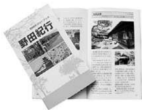
野田の見どころが一冊に