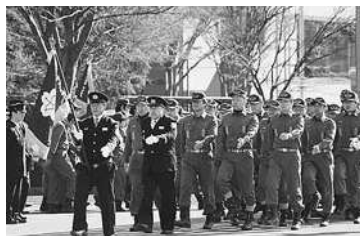
500人を超える消防団の迫力ある行進

消防本部は、1月11日に文化センターで消防出初式を開催し、署員や各地区の消防団員など約860人が防火への意識を新たにしました。