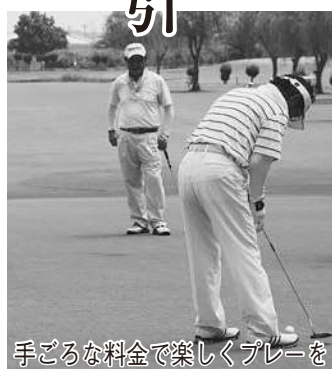
手ごころな料金で楽しくプレーを

なお、頂いた意見の概要や意見に対する市の考え方などは、個人情報を除き、市のホームページで公表します。