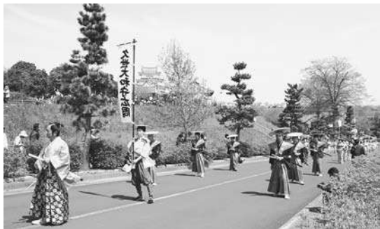
市民が参加した大名行列に多くの観客が注目

各公民館などにある申込用紙に記入し、郵送か直接〒270-0022 6 東宝珠花237-1 同実行委員会事務局(野田市関宿商工会内) ☎ 7198-0161 へ