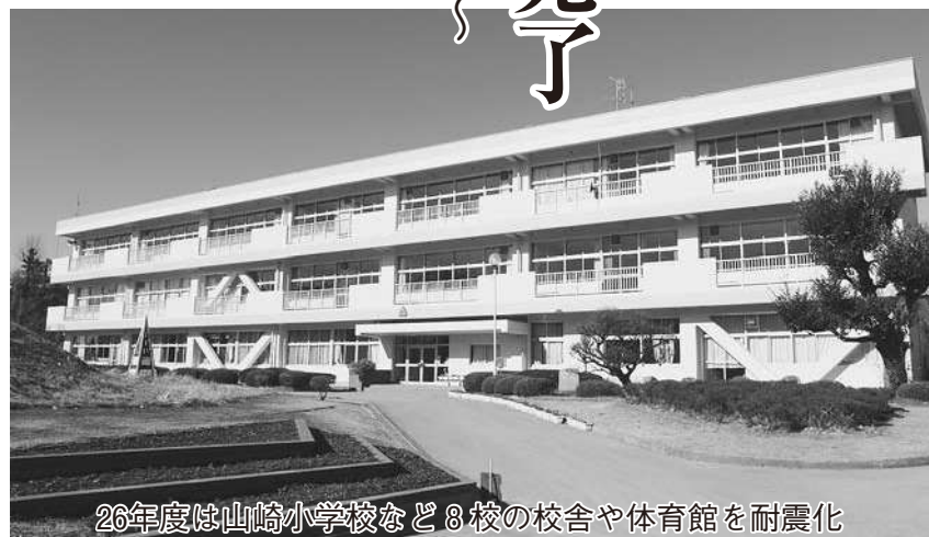
26年度は山崎小学校など8校の校舎や体育館を耐震化

来年度に耐震化工事を予定していた10棟のうち、清水台小学校、木間ヶ瀬小学校（普通教室