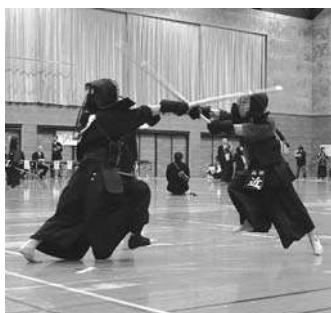
真剣勝負に鍛錬の成果を

電話で、柔道の部は山本☎7138-11324、剣道の部は大竹☎090-2477-8616へ 【問合せ】青少年課