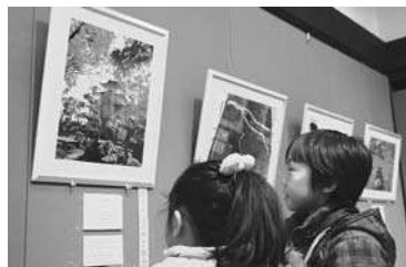
美しい写真に思わず見入る

県立関宿城博物館周辺を写真に収めた「関宿城百景写真展」が、1月12日から2月12日まで同館で開催されている。