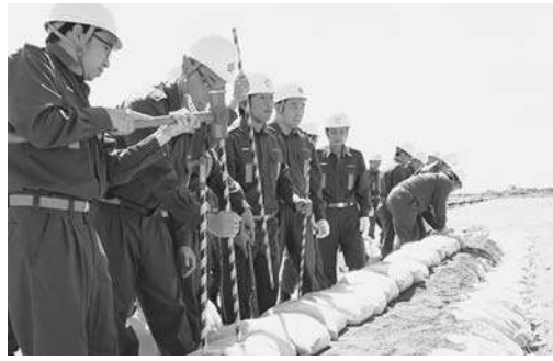
「水防訓練」で災害に備える