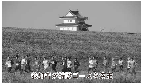
参加者が特設コースを疾走

真冬恒例のイベントである関宿城マラソン大会が、今年も2月1日(日)8時40分から県立関宿城博物館近くの利根川河川敷特設コースで開催されます。