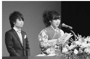
式典は実行委員33人による企画で