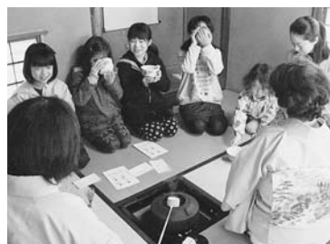
先生たちと話しながら伝統文化も学んで

関東最大級のコブシに 今年も真っ白な花が 県立関宿城博物館から江戸川に向かい橋を渡った中の島公園のコブシの木が、3月下旬から4月上旬にかけて真っ白な花を咲かせた。