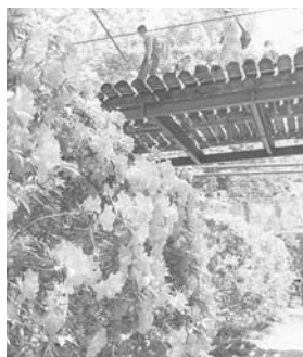
色とりどりのつつじが

毎年恒例の「つつじまつり」が4月18日(土)から5月6日(日)まで清水公園で開催されます。