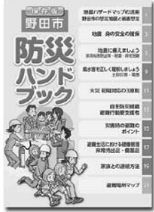
すぐ見られる場所に保管を

備えや避難場所マップなどを掲載した「防災ハンドブック」の内容を見直し、今号の市報に合わせて全戸配布しました。