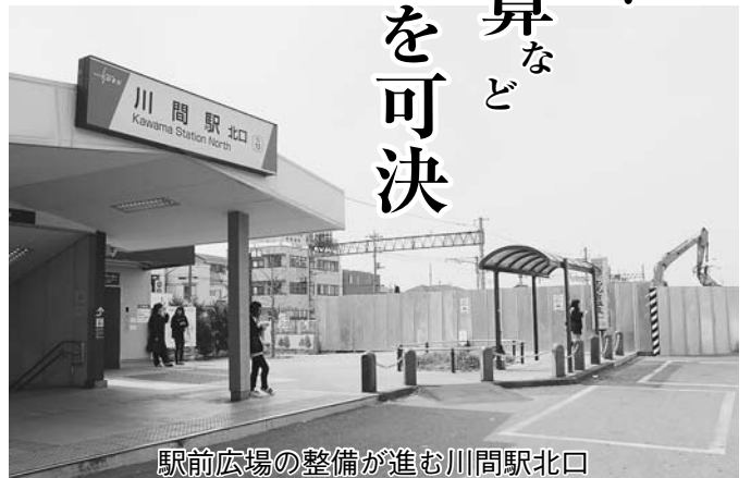
駅前広場の整備が進む川間駅北口

平成27年第1回定例市議会は、2月27日から開催され、川間駅北口駅前広場の整備や8月診察分からの子ども医療費助成の中学3年生までの拡大を含む新年度予算、新年度予算に予定していた子ども支援室事業を前倒しした26年度補正予算など、47議案と議員発議1件を可決し、3月23日に閉会しました。