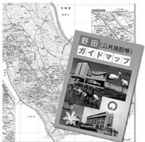
避難場所やバス路線も掲載

希望する方には、市役所（1階総合案内、3階秘書広報課）や関宿支所、各出張所のほか、各図書館・公民館、郷土博物館