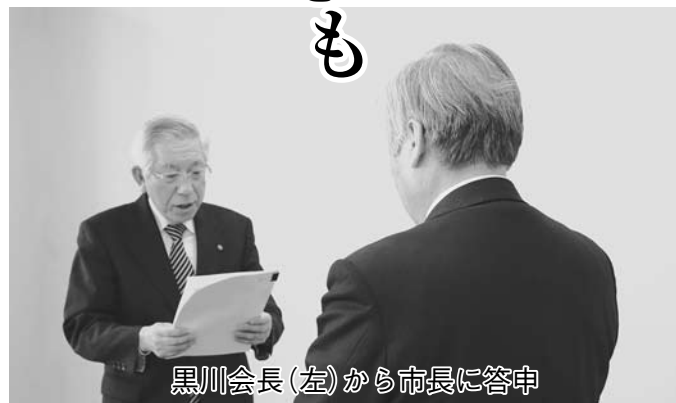
黒川会長(左)から市長に答申