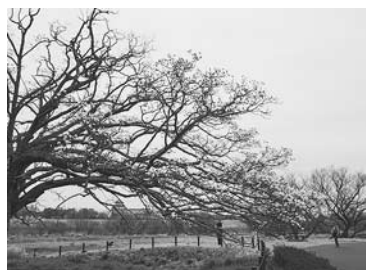
樹齢100年ともいわれるコブシ

コブシは、高さ約11メートル、樹径約3・5メートルで関東最大級といわれている。訪れた家族連れや写真愛好家などは、花をめたり、写真を撮ったりして開花を楽しんでいた。