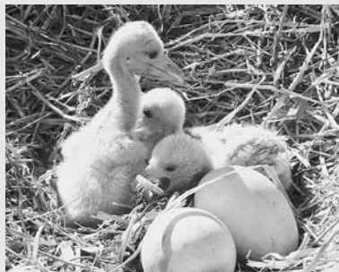
昨年より1か月以上早く誕生