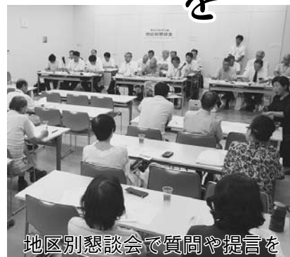
地区別懇談会で質問や提言を

これまで、公募の154人をメンバーとする分野別検討組織での検討、市民アンケート、地区別懇談会、各界懇談会、パブリック・コメント手続など、さまざまに市民参加の取り組みを経て策定した骨格案を基に、総合計画審議会ですべての施策や事業、指標・目標値、重点プロジェクトなどについて審議が重ねられ、次期総合計画の素案がまとまりました。