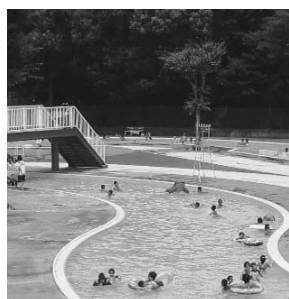
流水プールや競技用プールも

総合公園水泳場が7月4日オープン 7月4日 10時から9月6日 10時まで、総合公園水泳場を開場します。 【開場時間】9時～18時 【入場料】690円（中学生以下270円）、15時以降の入場は270円（中学生以下60円） また、入場11回分が6千990円（中学生以下は2千770円）の回数券（購入年度内有効）も販売しています。 【問合せ】総合公園 ☎7125-1155