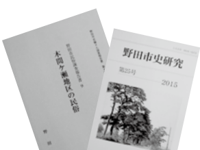
郷土史研究の成果が明らかに