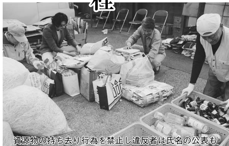
資源物の持ち去り行為を禁止し違反者は氏名の公表も