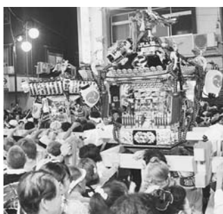
威勢のいいみこしに声援を

「野田みこしパレード」が、8月1日 日 15時から22時まで本町通り周辺（愛宕駅）下車徒歩約5分）で開催されます。