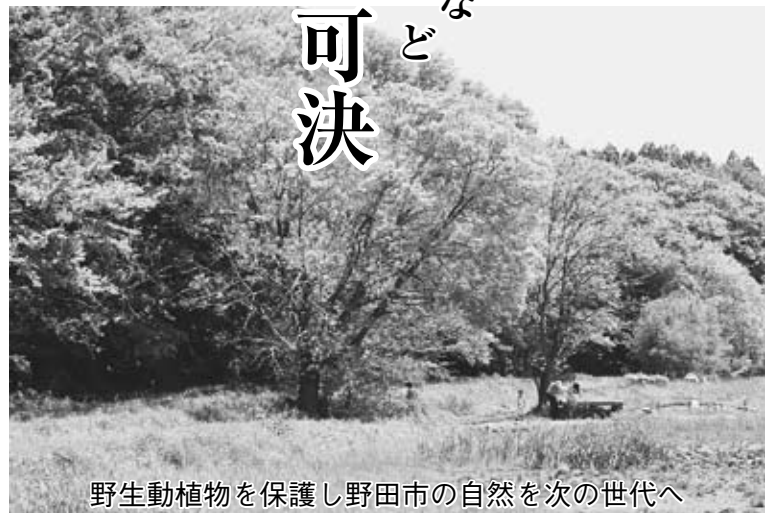
野生動植物を保護し野田市の自然を次の世代へ

画整理事業特別会計継続費繰越計算書の報告／平成26年度野田市一般会計繰越明許費繰越計算書の報告／平成26年度野田市国民健康保険特別会計繰越明許費繰越計算書の報告／平成26年度野田市の報告