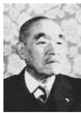
鈴木貫太郎翁 布し、期間内に3つスタンプを集め

【問合せ】野田夏まつり躍り七夕実行委員会(商工観光課内) ☎7123-11085