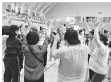
初めて参加の人とも輪になって

パン食いのレースや、樽太鼓の演奏などが行われた。よさこいソーランやフラダンスでは、見物人もアリーナに呼び込んで一緒に踊って、笑い声が体育館に響いていた。