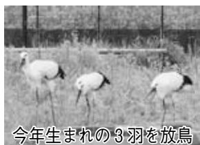
今年生まれの3羽を放鳥

3羽は、足輪などの取り付け後、施設の天井部分を覆うネットを外し、自然に飛び立たせるソフトリリースで放鳥します。