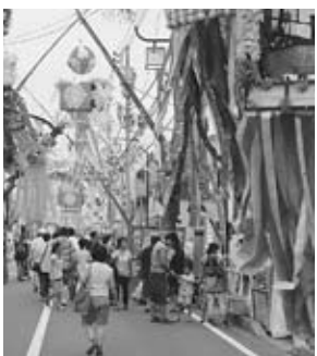
竹飾りやかな華を彩る通り

「おどりパレード」や「竹飾りコンクール」のほか、各イベント広場で音楽やダンスなどの催しを行います(雨天決行)。