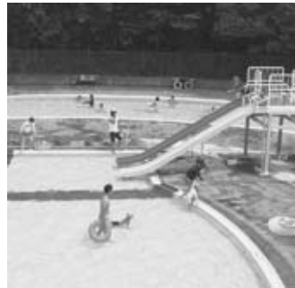
流水プールや子ども用プールも

◆総合公園水泳場の開場 9月6日 開場。開場時間は、9時～18時。入場料は60円（中学生以下は270円）、15時以降の入場は270円（中学生以下は60円）。入場11回分が6千990円（中学生以下2千770円）の回数券（購入年度内有効）も販売。 閩同園 ☎ 7125-1155