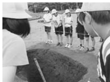
縄文時代の狩り用のおとし穴も

子どもたちは、「古墳時代の家は何人が暮らしたか」「おとし穴を掘るのに何日かかったか」などの質問をしたほか、土器や糸紡ぎの道具を手にとり、昔の暮らしに思いをはせていた。