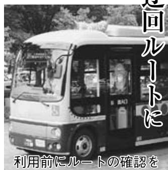
利用前にルートの確認を

7月17日(金)、19日(日)、8月1日(土)、8日(土)、9日(日)は、「三ヶ町夏祭り」と「野田みこしパレード」「野田夏まつり躍り七夕」の開催で本町通り付近の交通規制が行われます。期間中、まめバスは10時から終車まで迂回運行となり、一部バス停が利用できません。