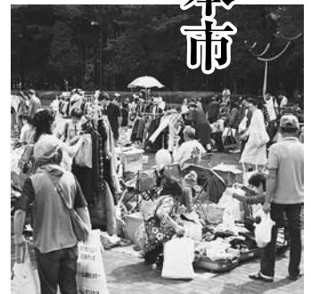
市役所前のフリーマーケット

【注意事項】①百科事典や週刊誌などは対象外、②書店のブックカバーは取り外す、③音楽CDなどはケースに入れる