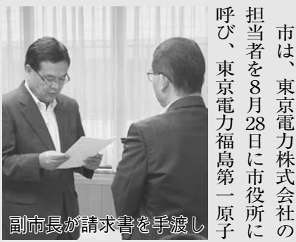
副市長が請求書を手渡し

市は、東京電力株式会社から、担当者を8月28日に市役所に呼び、東京電力福島第一原子力発電所の事故による放射性物質汚染への対策費として負担した2億2千475万4千99円を東京電力株式会社へ請求しました。 請求額は、平成26年度に市が負担した放射線対策費用のうち、国や県の補助金などの対象外となつている費用と、23年度から25年度に同社に請求し、未払いとなつている費用の総額です。