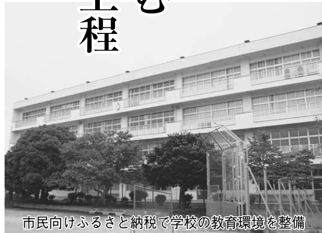
市民向けふるさと納税で学校の教育環境を整備