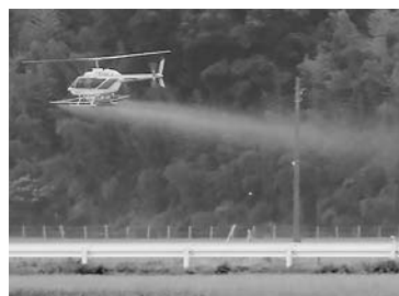
市内全稲作面積の半分に及ぶ規模に

減農薬と病気に強い稲づくりに平成21年度に始まったもので、野田産ブランドの黒酢米として出荷。今年度は、今上、関宿、木間ヶ瀬を加えた7地区496ヘクタールの耕地で収穫されている。