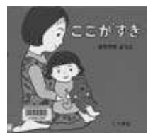
「ここがすき」きたやまようこ・作 こぐま社

興風図書館 ☎7123-7611 南図書館 ☎7125-7981 北図書館 ☎7129-8811 せきやと図書館 ☎7198-4946