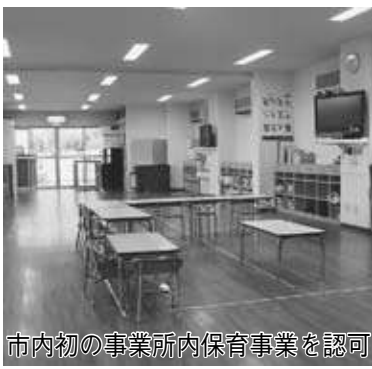
市内初の事業所内保育事業を認可

また、梅郷保育園の分園は、0歳から2歳までの利用定員54人の設定を児童福祉審議会です承をいただいております。本園の認可内容を変更する手続等を県と事前協議するなど、28年4月の開園に向けて準備を進めています。