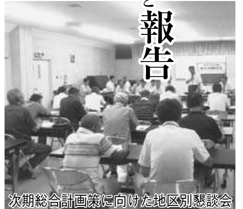
次期総合計画策に向けた地区別懇談会

◆ 災害対策基本法に基づく避難行動要支援者支援計画作成 要支援者名簿を自主防災組織や自治会のほか、民生委員・児童委員、社会福祉協議会、地区社会福祉協議会、警察や消防機関の避難支援等関係者に提供しました。これらの方には、名簿を活用して平常時の声かけや見守り、