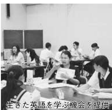
提供された英語を学ぶ機会を生きた

と、2日間集中して英語でコミュニケーションしました。生徒自身がいかに英語力やスピーキング力の向上を実感し、今後の英語学習への意欲付けとなりました。