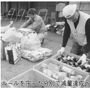
ルールを守った分別で減量達成へ

また、10月に開催予定の廃棄物減量等推進審議会では、他の自治体で推奨している生ごみ処理機や段ボールコンポストの状況を報告するとともに、啓発冊子の「野田市のごみの出し方資源の出し方」の内容の見直しや、指定ごみ袋無料配布枚数の減などについて審議いただく予定です。