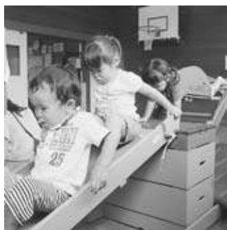
一緒に遊んで友達づくり

催し、子どもたちをいろいろなおもちゃで遊ばせながら、保護者同士で子育ての情報交換ができる交流の場として利用されています。