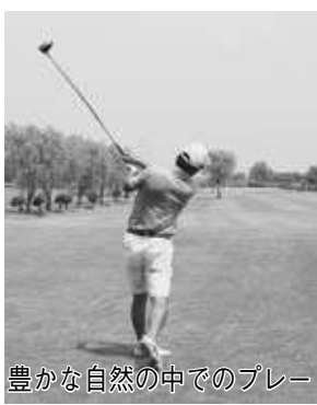
豊かな自然の中でのプレー