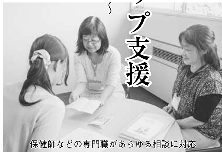
保健師などの専門職があらゆる相談に対応