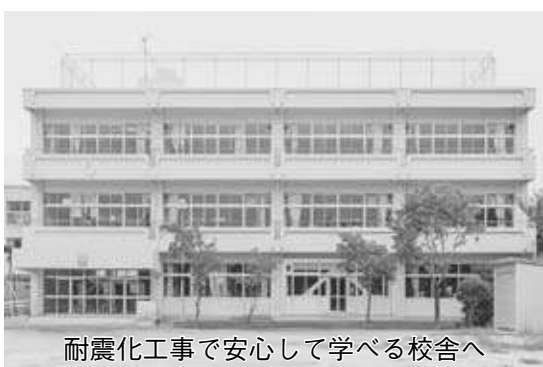
耐震化工事で安心して学べる校舎へ