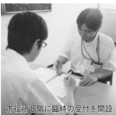
市役所8階に臨時の受付を開設

◆重度心身障がい者医療費助成金支給事業 8月診療分から現物給付方式に変更しました。受給資格があり、所得状況などを確認する同意書を提出していただいた方に、医療機関の窓口で提示する受給券を7月下旬に送付しま