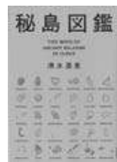
「秘島図鑑」清水浩史・著 河出書房新社

掲載された鳥々は、ほぼ無人島で交通手段は皆無。ガイド編では秘められた歴史が明らかにされています。さらに実践編として「行けない島」を身近に感じる方法を紹介。本書で秘島へ旅立とう！