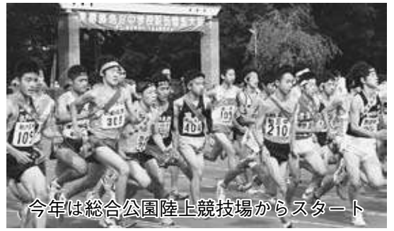
今年は総合公園陸上競技場からスタート

新制中学の発足を記念し、昭和23(1948)年2月に当時の東葛地区10町村が参加し行われたのが始まりです。