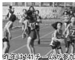
昨年141チームが参加

◆野田市民駅伝競走大会 11月15日 9時から総合公園で（予備日22日）。小学男子・女子の部7・4キロ、中学・高校・一般女子の部9キロ、