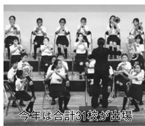
今年は合計31校が出演

～17時(入館は16時まで)茂木本家美術館で。「京都名所之内淀川」などを展示。700円(小:中学生400円)。要予約。申込みは事前に同館 ☎7120-1489へ ◆野田市小中学校音楽会 10月21日(日)、22日(日)9時30分～15時30分文化会館で。児童・生徒による合唱と合奏。臨時駐車場あり。当日会場へ。 ☎同指 ◆こわいお話し会 10月24日(日)15時～15時30分せきやど図書館で。ハロウィンのこわい話。幼児以上。当日会場へ。 ☎同館 ☎7198-4946 ◆おもちゃ病院野田 10月25日(日)総合福祉会館、11月1日(日)関宿中央公民館で。いずれも9時30分～正午。壊れたおもちゃの修理。部品代は実費負担。当日会場へ。 ☎小菅 ☎7124-1647 ◆国際交流フェスタ 10月25日(日)11時～15時イオンストア時計の広場などで。外国人の日本語スピーチ、民族舞踊、各国の料理・喫茶コーナー(有料)など。