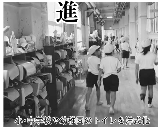
小・中学校や幼稚園のトイレを洋式化

◆確定申告が不要に 「ふるさと納税ワンストップ特例制度」が27年4月に創設され、確定申告が不要な給与所得者などがふるさと納税を行う場合、5団体以内であれば、確定申告を行わなくても寄附金控除が受けられるようになりました。 ◆市税の減収には補てん措置 ワンストップ特例制度を利用 (2面につづく)