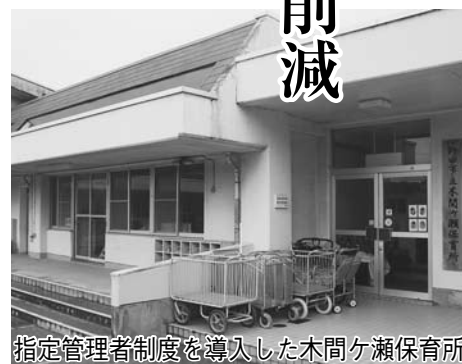
指定管理者制度を導入した木間ヶ瀬保育所

市は、行政改革の基本方針である「行政改革大綱」とその実施計画である「集中改革プラン」に基づき、計画的かつ積極的に行政改革を進めた結果、行政改革大綱の計画期間である平成21年度から26年度までの6年間で、約67億7千万円の財政効果をあげることができました。また、27年度からは「集中改革プラン」から名称を改めた「行政改革大綱実施計画」に基づき、引き続き財政の健全化とサービスの向上に取り組んでいきます。