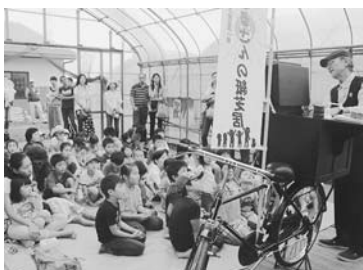
紙芝居で自然の大切さを再確認

と、江川地区の市民農園で9月27日、収穫祭が行われた。参加者は、田植えの思い出を話し合いながら、新米を受け取っていた。また、コウノトリを題材にした紙芝居や絵描き、ケト土を丸めて作る苔玉作りなどが行われ、自然とのふれあいに満ちた一日となった。