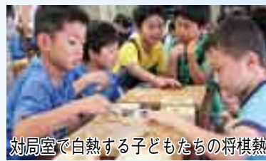
対局室で自熱する子どもたちの将棋熱

また、展示室の隣には、対局室があり、毎日、愛好者が将棋の駒を指し合う音が響いています。