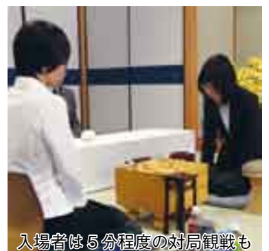
入場者は5分程度の対局観戦も

野田市成人式を、1月11日(日)10時30分(受付開始は10時)から文化会館で開催します。