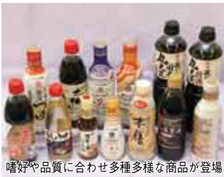
嗜好や品質に合わせ多種多様な商品が登場

伝承によると、野田での醤油醸造は、永祿年間（1558〜1570）年に飯田市郎兵衛が溜醤油を作ったことが始まりとも言われていますが、江戸時代の中ごろを過ぎると本格的に作られるようになります。