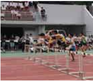
日本陸上競技連盟第3種公認を更新

◆総合公園陸上競技場の改修 トラックやフィールド内のウレタンなどを改修するため12月29