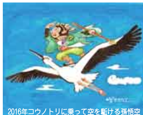
2016年コウノトリに乗って空を駆ける孫悟空 イラスト=稲葉多太司さん(清水)

半島から、南は鹿児島屋久島 まで生息しています。群れをつ くり、木の上を得意とし、主に、 果実や種子、花、葉などの植物 や昆虫を好んで食べるようです。 サルと人間はつきあいが深く、 サルにまつわることわざや慣用 句もたくさんあります。昔話の 「桃太郎」のサルや「西遊記」 の孫悟空は、主人を支える名脇 役として活躍しました。 また、大道芸として人気の「猿 まわし」は、一説によると「サ ル」「去る」に通じ、悪いものが 去る縁起の良い芸として、正月な