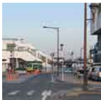
梅郷駅西口周辺も重点区域候補地に