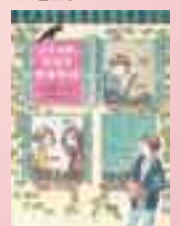
「ニレの木広場のモモ毛館」著 高橋方子、絵 千葉史子、ポプラ社

興風図書館 ☎7123-7611 南図書館 ☎7125-7981 北図書館 ☎7129-8811 せきやど図書館 ☎7198-4946