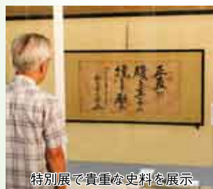
特別展で貴重な史料を展示

和天皇を支え、「永遠の平和」という言葉を遺してこの世を去られた貫太郎翁を偲ぶとともに、市民一人一人に平