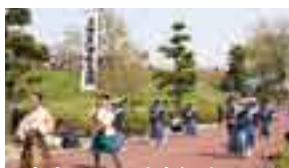
関宿城まつりで大行列の再現も

河川にかかわる歴史や文化を紹介し、かつての天守閣を模した展望室からは利根川の流れや、関東一円の山並みが一望できます。