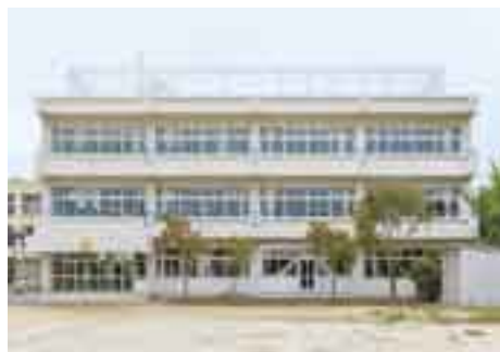
今年度は二小小校舎など計7棟を工事

木間ヶ瀬小校舎は12月21日、中央小記念館は1月25日までの完成を目指しています。宮崎小