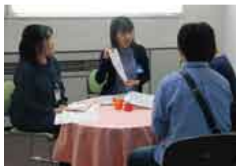
子育ての専門家があらゆる相談に対応

10月に保健センター4階に開設し、妊娠、出産から育児、就学など18歳までの子育ての相談にワンストップで対応しています。妊娠届出時の面接や来所・電話などの相談に応じ、11月20日現在、妊娠届を128件受理し妊娠中からの支援が必要と