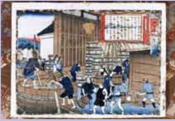
三代歌川広重作「大日本物産図会 下総国醤油製造之図」 明治10年の作。醤油蔵の様子が描かれており、醤油の質が上質品であると記されている。（野田市郷土博物館所蔵）

その後も、戦争の影響や戦後の復興、高度経済成長などを通して、醤油醸造産業の発展とともに野田市は繁栄を見せます。