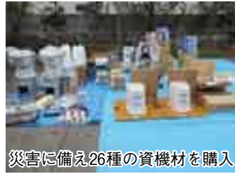
購入した26種類の備えに災害に 事業で、東金野井自主防災会が TENT や毛布などを購入。團防災安全課

◆野田市行政改革推進委員会 1月20日(日)10時から市役所8階大会議室で。先着10人。9時30分から受付。團行政管理課