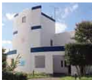
15人の地域枠を持つひばり保育園

11月1日時点の待機児童数は26人、待機児童を含む保育者数は174人で、4月1日時点との比較ではそれぞれ16人、55人の増です。前年同時期よりもそれぞれ40人、113人減の状況ですが、年度末にかけ低年齢児を中心に増加が予想されます。10月に開始した小張総合病院の事業所内保育所ひばり保育園は、11月1日現在、0歳から2歳まで10人が利用しています。