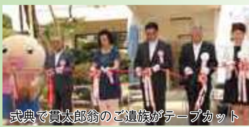
式典で貫太郎翁のご遺族がテープカット

鈴木貫太郎記念館は、貫太郎翁の没後、終戦時の内閣総理大臣としての業績を広く紹介するため、財団法人鈴木貫太郎記念