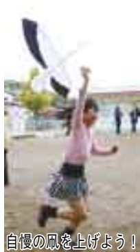
自慢の風を上げよう！