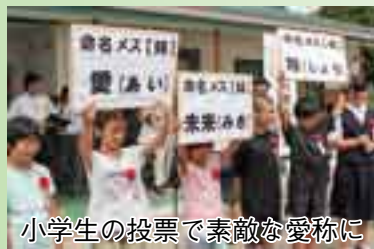
小学生の投票で素敵な愛称に

け、自然 ットを開 を覆うネ 設の天井 了後、施 式典終 です。 スガ「翔」 羽目のオ 3 「未来」 「愛」と「 それぞれの愛称は、1羽目と2 羽目のメスが「愛」と「未来」、3 た3羽の愛称を発表しました。