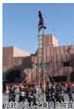
披露のほしご乗りを伝統

消防出初式を文化会館で行います。当日は7時にサイレンが鳴ります。当日は7時にサイレンが鳴ります。