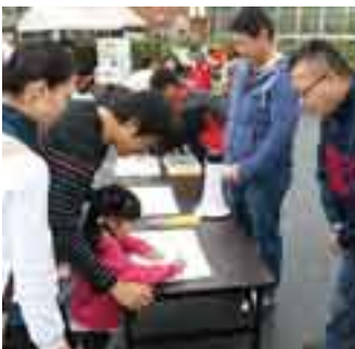
イベント会場などで署名活動を展開

設・誘致促進連絡協議会臨時総会で早急な署名活動が決まり、市でも野田商工会議所を中心に東京直結鉄道を実現する会が設立され署名活動を開始しています。