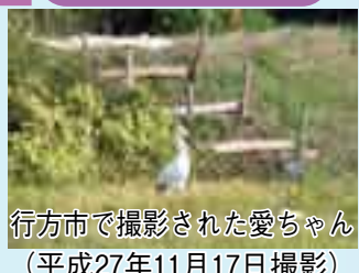
行方市で撮影された愛ちゃん (平成27年11月17日撮影)