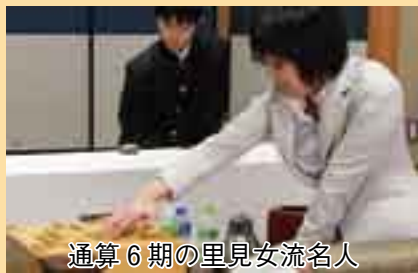
通算6期の里見女流名人