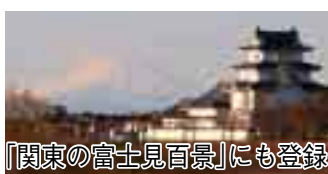
「関東の富士見百景」にも登録

平成7年に、利根川と江戸川に挟まれたスーパー堤防上に、県立関宿城博物館が開館しました。