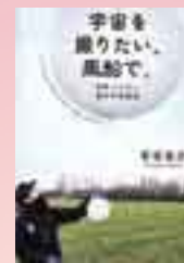
「宇宙を撮りたい、風船で。」著 岩谷圭介、宇野浩二

1月23日 10時〜正午総合福祉会館で。「原発事故・避難者アンケート〜何が福島の人々を苦しめているのか」を上映。当日会場へ。岡富村 ☎7125-4153