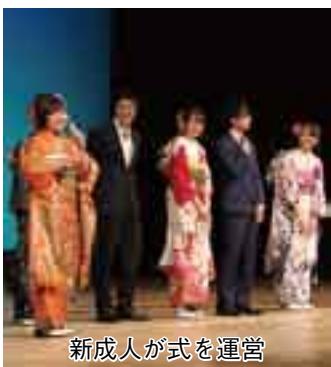
新成人が式を運営