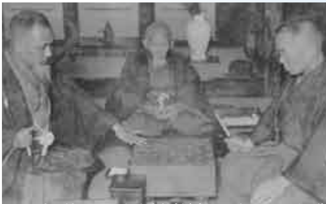
阪田三吉と対局する関根金次郎(左)(大正6年10月22日撮影)