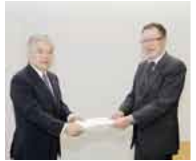
36回に及ぶ審議会を経て答申

◆ 次期総合計画の策定 23年度に総合計画審議会を立ち上げ、3年半をかけ9月に答申を頂きました。分野別検討組織からの提言書、市民アンケート、地区別・各界懇談会、パブリック・コメント手続などこれまで以上の市民参加の取り組みのもと、総合