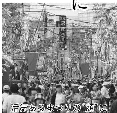
活気あるまつりの“顔”に

【応募方法】商工観光課の窓口や、野田市観光協会ホームページで配布する所定の応募用紙か、A4サイズの白色用紙(縦長で使用)を使用し、①キャラクター