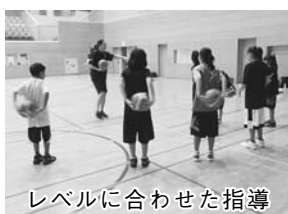
レベルに合わせた指導

◆関宿総合公園体育館で小磯典子氏(バスケットボール元日本代表)のバスケットボール教室 ①初心者教室…3月24日～4月14日の毎17時～18時20分。全4回。未就学児・小学6年生の未経験者・初心者。②経験者・スキルアップクラス…3月24日～4月14日の毎18時30分～20時。全4回。小・中学生。いずれも4千800円(1回千350円)。申込みは電話か往復はがき(住所・氏名・ふりがな・年齢・☎を明記)。