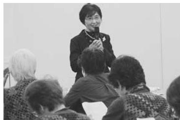
クリーニングに出す前の確認事項も説明

12月から変わる衣服の取扱い表示の知識を知ってもらおうと、消費生活セミナー「新しい洗濯表示記号と衣料品」を2月9日、市役所中会議室で開催した。