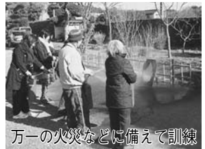
万一の火災などに備えて訓練

◆消火器の種類 ◆粉末系消火器：瞬時に消火し ◆消火器の種類 ◆粉末系消火器：瞬時に消火し