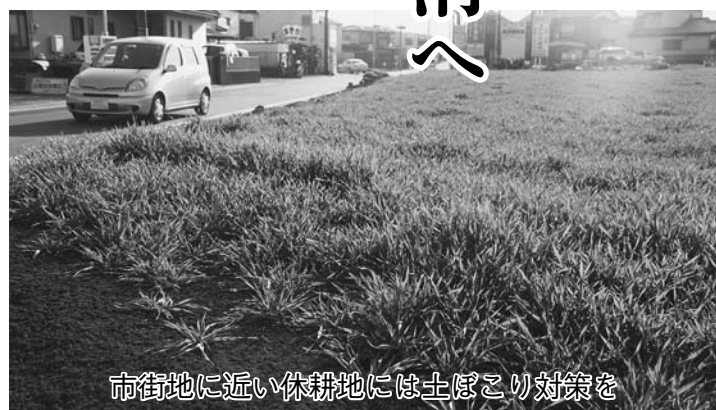
市街地に近い休耕地には土ぼこり対策を