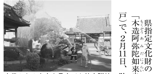
本堂からの出火を見立てた放水訓練

訓練には、地域の人が約100人が参加し、消防車による放水や文化財の持ち出し訓練、煙体験、消火器やAEDの操作体験などを実施。参加者からは、通報時の注意点などの質問もたくさん出ていた。