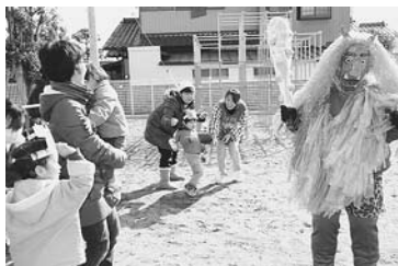
幼児が集まり懸命に鬼退治

親子の「豆まき会」が、節分の2月3日に地域子育て支援センターで行われた。豆を入れる升や鬼の面を作ったあと、子どもたちが園庭に集まると、職員ふんする赤鬼と青鬼が登場。驚き泣き出す子もいたが、いつせいに豆を投げると鬼は徐々に退散。子どもたちは「怖かったけど、がんばって投げたらいなくなった」と話していた。