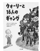
「ウォーリーと16人のギャング」 リチャード・ケネディ・文マーク・シモン・文 大日本図書