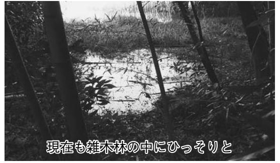
現在も雑木林の中にひっそりと