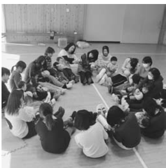
明るい雰囲気の中で親子が運動

七光台子ども館は、昭和61（1986）年に、市内で5番目の児童館として開館しました。館内には、図書館と工作室、体育室があり、卓球やバドミントン、ドッジボールなどで元気に遊ぶ子どもたちの声が響きます。同館は、午前中は0歳から就学前までの年齢に応じた親子サークルの活動が中心で、わらべ歌で始まり、工作や季節行事で親子の触れ合いを深め、楽しいひと時を過ごしています。中でも、土曜日の午後は、小学生の「ともだちクラブ」で、ネイチ