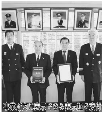
事業所内に表示できる表示証を交付

今回、ちば東葛農業協同組合（J A ちば東葛）の市内12事業所を、1月21日に消防団協力事業所の第1号に認定しました。