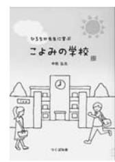
「ひろちか先生に学ぶ ちかみよの学校」 中牧弘允 著、中牧ばね舎 著