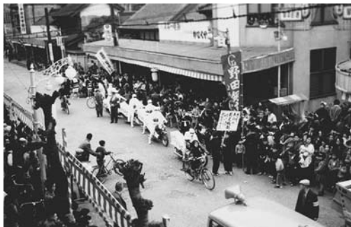
写真提供＝大澤巳喜雄さん(上花輪新町)