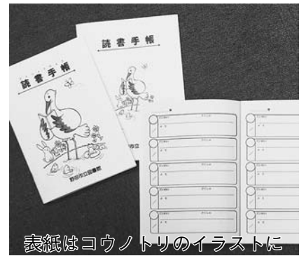
表紙はコウノトリのイラストに