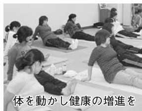
体を動かし健康の増進を

4月11日～5月30日の(日)19時30分～20時50分総合公園体育館で。全8回。高校生以上。先着35人。2千500円。申込みは3月20日(日)から前日までに直接同館窓口☎125-1155へ