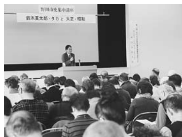
講師の話に聞き入ったりメモをしたり

人が集まった。「戦時宰相としての鈴木貫太郎」と題した講演のほか、閑宿に残されていた、戦前のタカ夫人宛ての書簡が解読され、当時の2人の様子なども明らかにした。