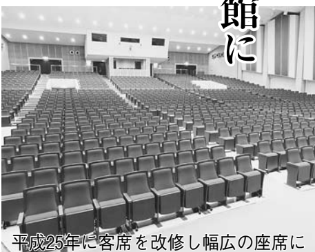
平成25年に客席を改修し幅広の座席に