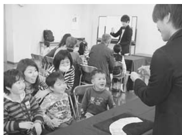
交流では理科や大学生活への質問も

南図書館で開催され、40人が参加した。トランプやロープのマジックが披露されたほか、ストーリーのマジックが参加者に伝授され、子どもたちが早速親に実践する場面も見られた。