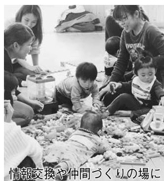
情報交換や仲間づくりの場に