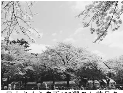
日本さくら名所100選のお花見を

4月10日(日)：期間中は、日没から22時まで公園内のライトアップが行われるため、鮮やかに咲き誇る約2千本の桜を昼夜を問わず楽しむことができます。