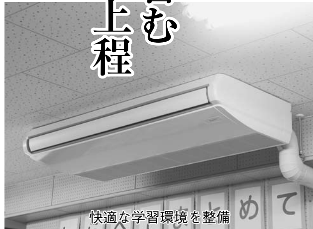
快適な学習環境を整備