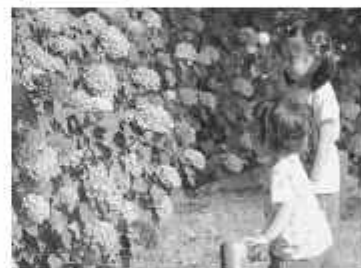
赤紫や青、白の花の色とりどりに

アジサイは平成8年に旧野田市の人口が12万人を突破した記念に植えられた。花の前を通った家族連れは「この季節になると、咲き具合が気になって通るたびに確認しています」と話した。