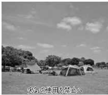
火気の使用を禁止へ

◆議案第3号 野田市行政手続における特定の個人を識別するための番号の利用等に関する法律に基づく個人番号の利用及び特定個人情報提供に関する条例の一部を改正する条例の制定 個人番号及び特定個人情報を利用することができるとして、野田市ひとり親家庭等医療費助成金支給に関する条例及び野田市子ども医療費の助成に関する規