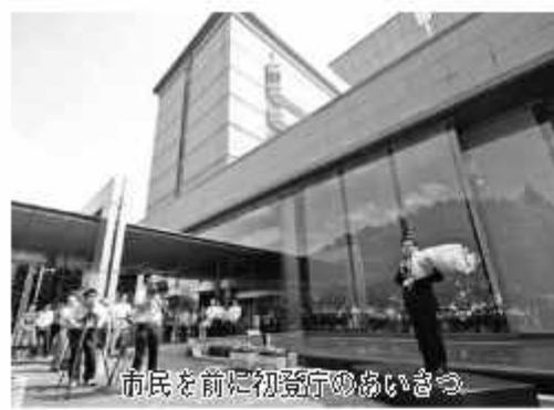
市民を前に初登庁のあいさつ

そこで、今後の市政を運営していく上での基本姿勢として、まず行わなければならないのは、若い人が安心して結婚、そして子育てをしたいと思うことがで