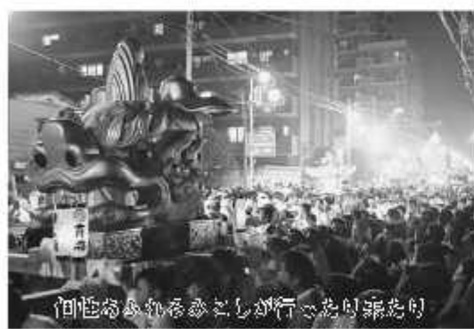
みこしパレードが行われる様子

【問合せ】野田みこしパレード実行委員会（野田商工会議所内） ☎7122-13585