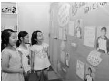
柏レイソルの選手5人が直筆で

「自分を信じて」などと、選手からの色紙を読んだ小学生たちは、保育士、ベントショップスタッフ、アイス屋さんと目を輝かせながら夢を再確認していた。 ※巡回の詳細は、市報6月1日号11面か、東風園書館 ☎7123-1761 に確認してください。