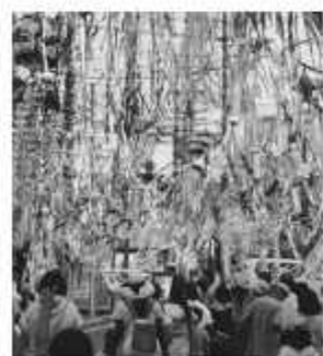
華やかな竹飾りを夏の思い出に

今年第65回目の記念開催となり、「おどりパレード」や「竹飾りコンクール」のほか、各イベント広場で音楽やダンスなどの催しを行います(雨天決行)。