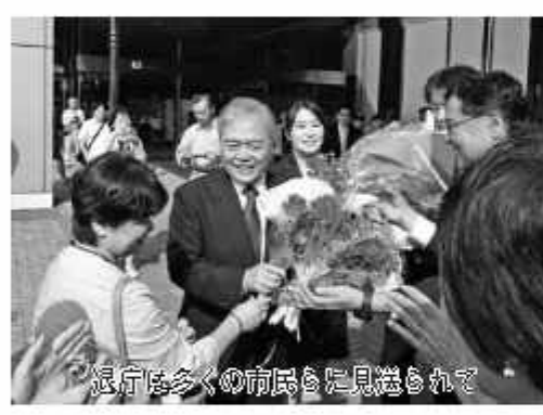
退任は多くの市民らに見送られて

まず、市政の根幹であります基礎的な自治体としてのサービスの提供に万全を期しながら、生活基盤の整備を進めることができました。