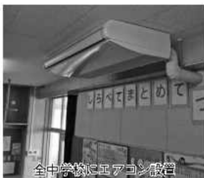
全中学校にエアコン設置

◆議案第5号 野田市立北部中学校空調設備設置工事請負契約の締結 野田市立北部中学校空調設備設置工事を施工するため、請負契約を締結