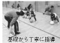
基礎から丁寧に指導

18時20分(8月18日のみ18時)19時20分(全4回)未就学児(小学6年生)4