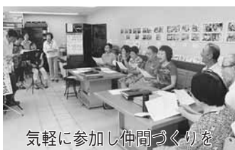
気軽に参加し仲間づくりを

9月29日(日)10時～14時シルバースalonはつらつ・ゆうみいで。200円。入退場自由。はさみ持参。当日会場へ。岡同サロ ☎7193-2137(10時～15時)へ