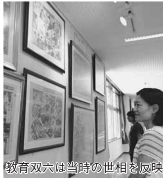
教育双六は当時の世相を反映

小中学校の校舎や体育館は児童生徒の学習の場だけでなく、災害発生時には避難所として使用されることから、学校施設の耐震化計画に基づき、耐震化を進め、平成27年度に全ての工事が完了しました。