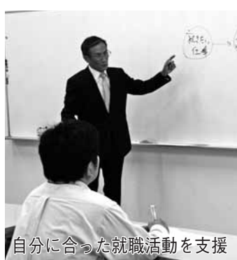
支援活動就職に合った自分