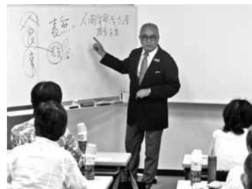
センター利用者や一般の方40人が参加

「カエルやザリガニいたよ」 水田型市民農園で稲刈り 市がビオトープ(生物生息空間)化を進める江川地区の水田型市民農園で、8月28日に(株)野田自然共生ファーム主催の稲刈りが行われた。