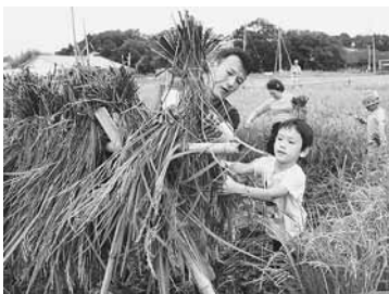
家族連れなど約230人が農業体験

稲を鎌で刈り、束ね「のろし」にかける昔ながらの農作業に挑戦。子どもたちも泥んこになりながら、お父さんお母さんのお手伝い。顔を出した生き物たちを見つけ、笑顔になっていた。