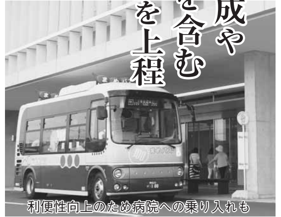
利便性向上のため病院への乗り入れも

平成28年第3回定例市議会は、9月2日から28日までの会期で開催されています。今議会では、子どもへの放射線の影響を心配する保護者の不安を軽減するための甲状腺超音波検査費用助成事業やまめバス利用者400万人達成記念事業などの補正予算案など、9議案を上程し審議されています。