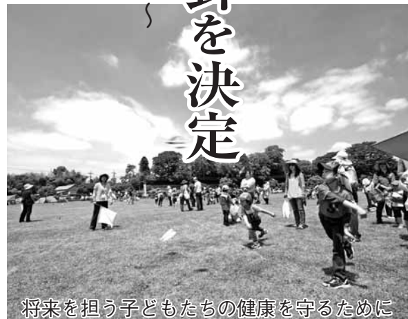
将来を担う子どもたちの健康を守るために