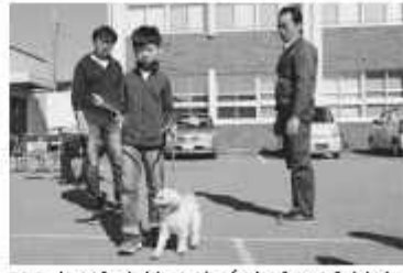
モデル犬を使った赤き方の実演も

飼いだへの正しいしつけ方を学んでもらおうと野田健康福祉センターで、犬のしつけ方教室が11月3日に開催され、33人が参加した。大型犬2匹を飼う参加者は「1歳の子犬がいるので、改めてしつけのため参加しました。子どもと犬が安心して触れ合えるよう、しつけを早速実践します」と犬への愛情と責任をますます感じた様子だった。