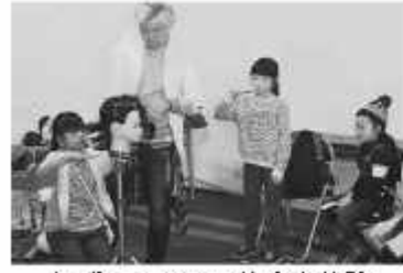
各ブースで20の仕事を経験

子どもたちに将来の夢を見つける足がかりにしてもらうと、野田商工会議所青年部が中心となり11月6日に「キッズタウン」がイオンストア野田駐車場で開催された。親子ら2千人が来場。参加者は、美容師や職人、医師などの職業を体験する子の姿に「初めての仕事でも楽しそう。自分の好きなことがわかるといいですね」と話していた。