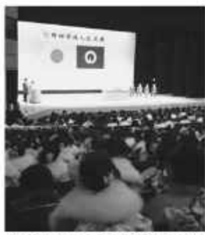
今年は1,564人が新成人に

◆1月 4日～3月21日 郷土博物館で市民の文化活動報告展「おばあちゃん、おじいちゃんこれ、なに？なつかしの暮らしと道具」 10日 文化センターなどで「消防出初式」 11日 文化会館で「野田市成人式」