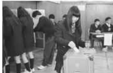
実際の投票箱や投票用紙を使用