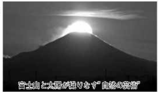
富士山と太陽が並びます「自然の芸術」

富士山頂に夕日が重なって沈む光景は、まるでダイヤモンドが輝くように見えることから、「ダイヤモンド富士」といわれ、気象条件がそろったときだけに見られる貴重な光景です。