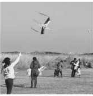
コウノトリ凧が大空を舞う

20日 株式会社セブンイレブン・ジャパンと災害時の物資供給協力に関する協定を締結 31日 スポーツ公園で「コウノトリに届けー凧あげin野田」