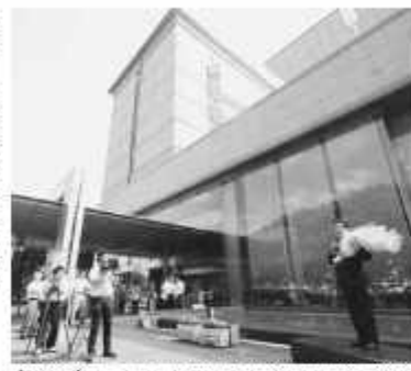
初登庁で市民と職員を前に所信表明