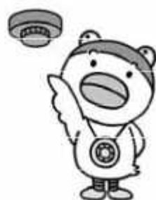
10年ごとに“とりカエル”

「住宅用火災警報器」は煙や熱を感じて警報音や音聲で火災を知らせる機器です。火災を初期段階で抑えるため、平成18年に全国すべての住宅での設置が義務付けられました。野田市においても現在約8割の住居に設置されるなど、普及が進んでいます。