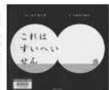
「これはすいへいせん」著 谷川俊太郎・ぶん tupera tupera・え全の星社

田風回書館☎7123 7611 南回書館☎7125 7981 北回書館☎7129 8811 せきやど図書館☎7198 4946