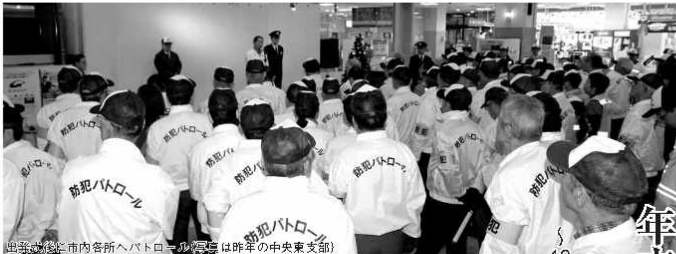
出発式後に市内各所へパトロール（写真は昨年の中東支部）

発行：千葉県野田市役所（〒278-8550 野田市鶴奉7番地の1 ☎047125-1111代表） ホームページ＝ http://www.city.noda.chiba.jp 携帯電用のホームページ＝ http://mobile.city.noda.chiba.jp