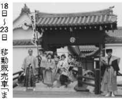
大名行列が練り歩き往時の情景を再現

18日～23日 移動販売車「まごころ便」運行千日目の記念セール 9日 早立宿宿城博物館周辺で「関宿城まつり」と「関宿城さくらまつり」 2日～7月4日 郷土博物館で企画展「野田に生きた人々その生活と文化2016」 1日 図書館で「読書手帳」の配布開始