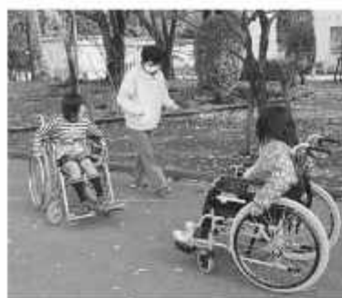
車いすに乗る体験も

「障がい者大会」や「おひさま」といっしょに「サンスマイル」、「福祉のまちづくりフェスティバル」、「ふれあいハートまつり」といったイベントや講演会を中心に、市民やボランティア団体、障