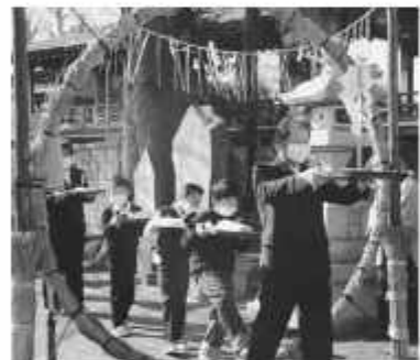
五穀豊穡と無病息災を願って

20日 株式会社セブンイレブン・ジャパンと災害時の物資供給協力に関する協定を締結 31日 スポーツ公園で「コウノトリに届けー凧あげin野田」