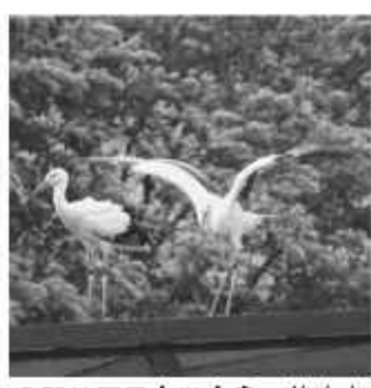
2羽は同日中に大空へ旅立ち

4日 放鳥式でコウノトリ幼鳥2羽に愛称「きずな」「ひかる」を命名し、2年連続の試験放鳥