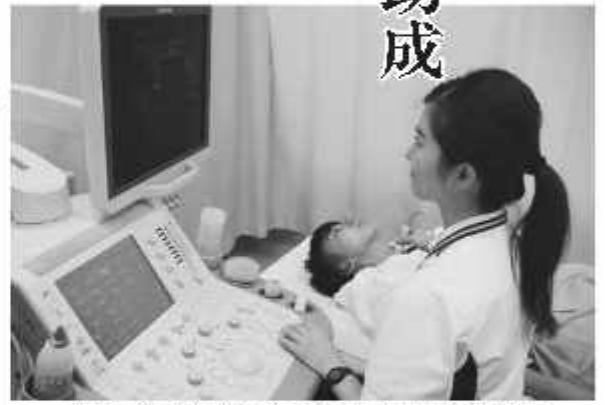
一部助成で検査の自己負担金額は3,060円に

平成28年も残りわずかとなりました。今年も、「一人のつながりがまちを変えようみんなであつくる 学びと笑顔あふれる コウノトリも住めるまち」を将来都市像とする新野田市総合計画をスタートさせました。また、コウノトリの2年連続の試験放鳥や、放射性物質による子どもへの健康被害の不安を軽減するための甲状腺超音波検査費用の一部助成の開始など、さまざまな施策を展開してきました。本号では、11月までの主な施策や出来事を振り返ってみました。