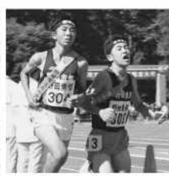
東葛飾区域6市の計71校が参加