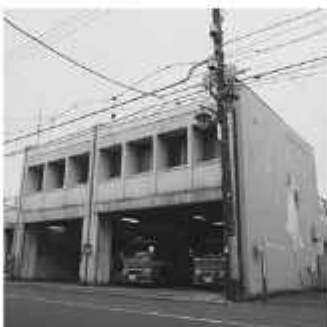
地域に根付いた防災拠点として

消防署中央分署は、昭和46(1971)年に中野台に開設しました。旧市庁舎跡に平成10年に建設された櫻のホール南側に位置する分署は、水槽付消防ポンプ自動車2台と、救急救命士による高度な応急手当が可能な高規格救急車1台が配備されています。現在、中央分署には年間千回程度の緊急出動がありますが、分署長以下22人の署員が3班体制で対応し、24時間緊急時に備えています。ほかに、自主防災組織や自