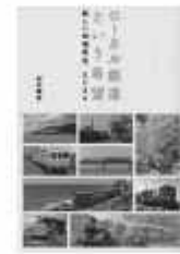
「口カル鉄道という希望」著 田中健二 河出書房新社

「赤字を抱えた地域のお荷物」というイメージだった口カル鉄道が、近年では地域の活性化に貢献しています。電車の運転体験やフォトコンテストなど、新たな試みを始めた社員たちの奮闘に注目です。