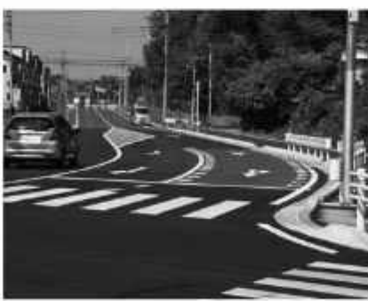
歩道も整備し歩行者の安全を確保

社権御膳献上式」 11日 普門寺で県指定有形文化財「絹本着色釈迦涅槃図」公開 23日 「人口ビジョン及びまち・ひと・しごと創生総合戦略」を策定 ◆3月 1日 要支援1・2のホームヘルプとデイサービスが「介護予防・日常生活支援総合事業」に移行 19日～4月10日 清水公園で「さくらまつり」 25日 「都市計画道路境台柳沢線」が一部開通