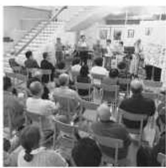
ハーモニカやバンド演奏で開幕

1日 シルバースロン「元気」の休所日に「商速スクエア・フリースペース元気」を開所