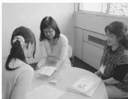
子ども支援室は他市に先駆けて導入

プランの内容には、待機児童の解消への取り組みや、27年に開設した子ども支援室の運営状況などが含まれています。