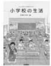
「小学校の生活」はまのゆかえ学研ブックス

けんたくんは今日から1年生。小学校っていったいどんな所だろう？お友達はたくさんできるかな？楽しいこといっぱいあるといいな。そんなけんたくんの小学校生活をのぞいてみませんか？