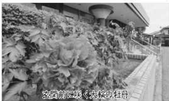
玄関前に咲く大輪の牡丹

いちいのホール正面玄関前では、毎年、春先から5月にかけて、「牡丹」が大輪の花を咲かせています。