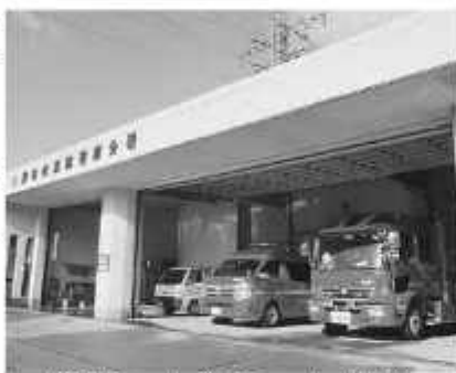
消防車2台・救急車1台を格納

消防署南分署は、昭和60(1985)年に二ツ塚に開設しました。 南分署は、南部・福田地区を主に管轄しており、消防団南方面隊の13人とともに、地域の防災活動に取り組んでいます。 平成16年に隣北出張所が開設され、1署4分署1出張所体制が整ったことから、市内全域での「緊急車両の5分以内の到着体制」の一翼も担ってまいりました。 また、平成25年からは、東高飾6市が、千葉北西部消防指令センター(松戸市)からの消防