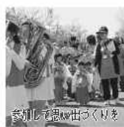
参加して思い出づくりを 実行委員会事務局では、一般の方々が参加できる「武者行列と稚児行列」

【武者行列・稚児行列の申込みと問合せ】3月10日(土)までに商工観光課、野田市関宿商工会、各公民館などにある申込用紙に記入し、郵送か直接〒270-0022 6 東宝珠花227-1 同実行委員会事務局(野田市関宿商工会内) ☎7198-0161へ