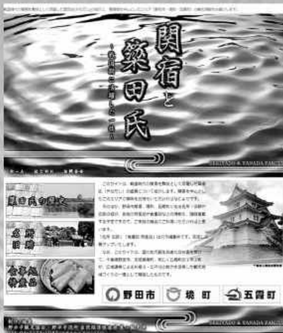
ホームページのトップ画面