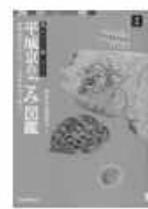
「ごみ文化の謎」著者 亀井 直幸 「奈良文化財研究所」編集 河出書房新社

日常生活をする上で必ず出てくる「ごみ」。実は「ごみ」を調べるとその時代の食と暮らしを知ることができるといいます。そんな奈良時代の「ごみ」をカラー写真でわかりやすく紹介しています。