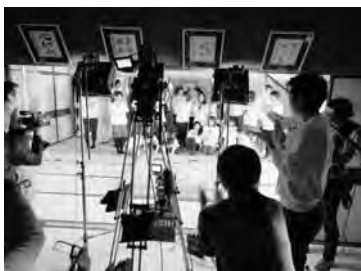
ラストシーンは対局室で撮影

映像作品を撮影し、3月中旬からインターネット上で公開予定。市では、将棋の振興に役立てていただくとうと、関根名人記念館等をロケ地として貸し出し、野田で映像の一部が撮影された。