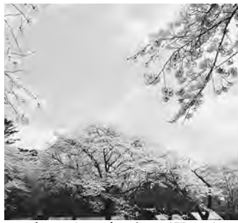
日本さくら名所100選にも

【問合せ】野田市観光協会(商工観光課内) ☎71231-1085(平日のみで8時30分から17時15分まで)