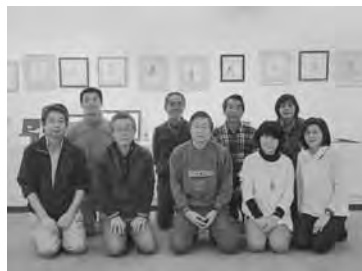
野鳥の絵画や写真など55点を展示

同会では「豊かな自然環境が今も残る野田は『宝の山』。近隣では見られない鳥も生息したり訪れていきます。観察会を通して多くの方にその貴重さを伝えていきたいですね」と話していた。