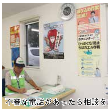
不審な電話があったら相談を

市や厚生労働省が、医療費の給付や保険料の還付の手続きでATMの操作をお願いすること