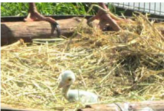
残りの1羽のヒナは元気な様子