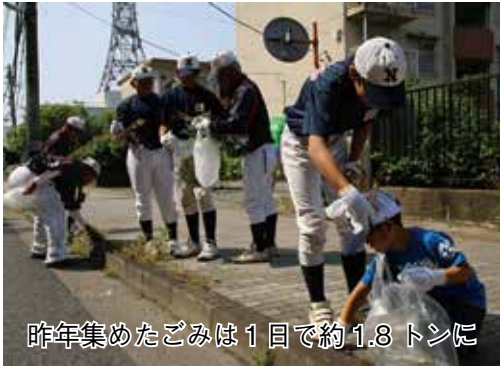
昨年集めたごみは1日で約1.8トンに

ごみの散乱防止やリサイクル意識の向上、きれいな河川敷を保つために、「ゴミゼロ運動」と「江戸川クリーン大作戦」を行います。