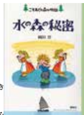
水の森の秘密 岡田淳・著 理論社

花を飾るだけで、いつもの部屋が違って見えます。この本は、手に入りやすい花を取り上げ、出回る時期や扱い方、楽しみ方などを教えてくれます。花を暮らしに取り入れるきっかけになる本です。