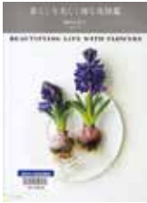
「暮らしを美しく飾る花図鑑」 増田由希子・著 家の光協会

興風図書館 ☎ 7123-7611 南図書館 ☎ 7125-7981 北図書館 ☎ 7129-8811 せきやど図書館 ☎ 7198-4946