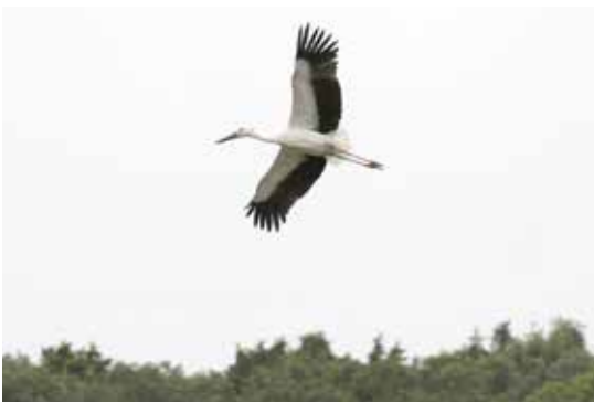
放鳥後もしばらく江川地区で棲息(昨年)

市では、市民の皆さんに市政に直接参加していただくこと、「審議会等への公募委員の導入に関する基本方針」に基づき、公民館運営審議会と社会教育委員と障がい者基本計画推進 市では、市民の皆さんに市政に直接参加していただくこと、「審議会等への公募委員の導入に関する基本方針」に基づき、公民館運営審議会と社会教育委員と障がい者基本計画推進 協議会と人権施策推進協議会の4つの審議会などの委員の公募を行います。 希望する方は、配布している募集案内の内容を確認の上、応募してください。