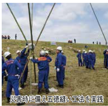
災害時に備え五徳縫い工法を実践