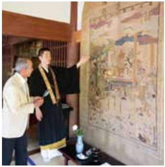
1665年8月の第25世弘栄師の時に制作

◆刺繍釈迦涅槃図の公開 5月8日(土)9時～17時清泰寺(東金野井)で。年に1度の県指定文化財の一般公開。圃清泰寺 ☎7129・4119