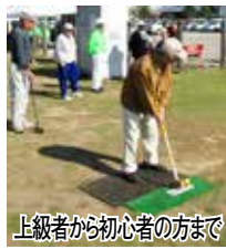
上級者から初心者の方まで 室か関宿 総合公園 体育館窓 口へ。閩社 会体育課

7 月の発生件数：1 件 29 年累計 (35 件) 建物火災 1 件 (13 件) 林野火災 0 件 (4 件) 車両火災 0 件 (1 件) その他 0 件 (17 件)