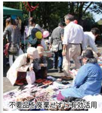
不要品を廃棄せず有効活用

市では、ごみの減量とリサイクルの推進のため、10月14日(日)に市役所を会場に「野田市リサイクルフェア」を開催します。