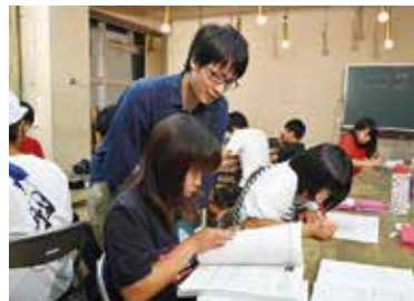
「わかるまで教えてくれる」と生徒に好評

疑問点があれば、講師の大学生や社会人に気軽に質問できる。は数学と英語を自習する。持ってきた教材や学校の宿題など（現在は数学と英語）を自習する。