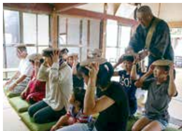
実相寺では100年以上前から続いている

参加者の頭に乗せたほろうろくの上に置いたもぐさに火を付け、灸を据える。夏の行事の一つとして続いており、「祖父の代から、夏バテ防止にきています」と話す人もいた。