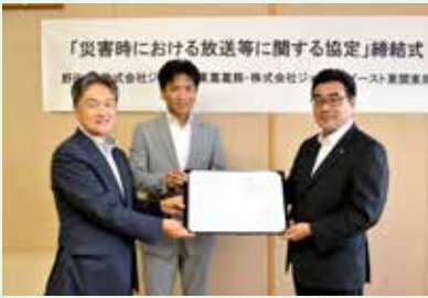
左から、株式会社ジェイコム東葛飾代表取締役社長、株式会社ジェイコムイースト東関東局長、野田市長