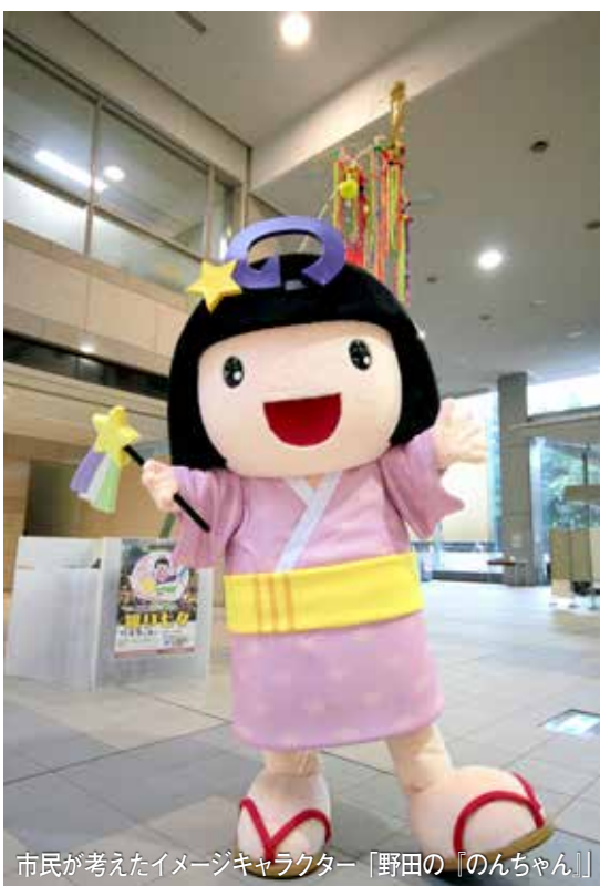
市民が考えたイメージキャラクター「野田の『のんちゃん』」

が作詞作曲したもので、皆さんに楽しく踊ってもらえるよう、振り付けが作られました。歌詞は、子どもにもわかりやすい言葉で表現され、コウノトリや醤油、枝豆など野田の魅力や特産品などが盛り込まれ、音楽は、軽快なリズムで皆さんに愛される曲に仕上がっています。