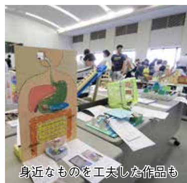
身近なものを工夫した作品も

「野田市小・中学校児童・生徒自然科学作品展」を市役所8階大会議室で行います。夏休み中に子どもたちによって作成された自然科学の論文や工作、昆虫の標本など各学校の代表となった力作を展示します。