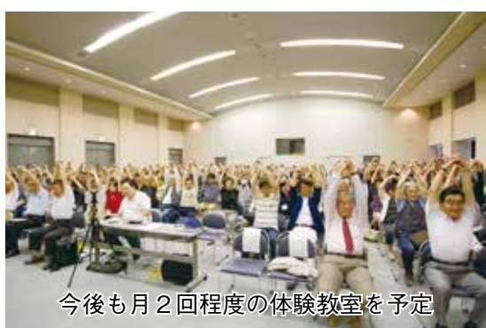
今後も月2回程度の体験教室を予定