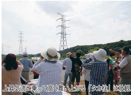
上昇気流に乗って高く舞い上がる「タカ柱」は社観