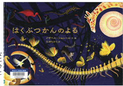
はくぶつかんのよる イザベル・シムレール・文 絵 石津ちひろ・訳 若波書店

誰もいなく、つた博覧館をのぞいてみましょう。何一つ、ぴくりとも動かない館内で、蝶が小刻みに羽を震わせたと思つたら、実在の博物館が舞台のファンタジー&科学絵本です。