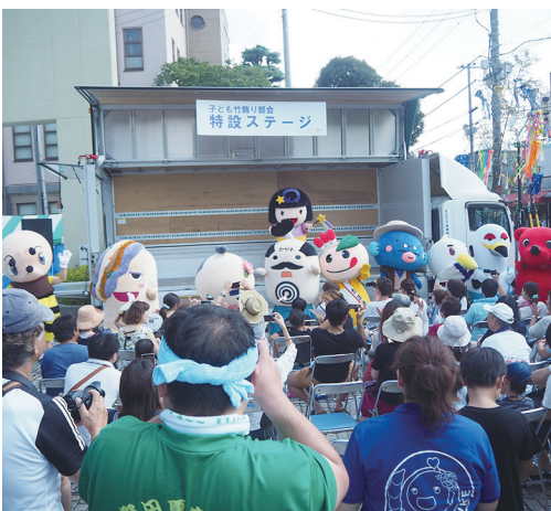
個性豊かなご当地キャラのコミカルな動きに歓声が

8月5日、6日に本町通り周辺で夏まつり躍り七夕が開催された。6日は、市の躍り七夕のイメージキャラクター「野田の『のんちゃん』」や関宿商工会青年部のマスコットキャラクター「やど助」のほか、近隣市のご当地キャラなど10キャラが登場。来場者と写真撮影に応じながら、各の特産品や地域の魅力をアピールしていた。