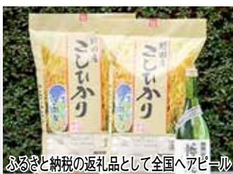
黒酢を散 布する、 全国的に も珍しい 栽培方法 に加えて、 減農薬・ 化学肥料