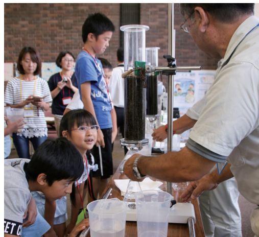
泥や色素などの小さい粒子は砂の層で除去

行政の役割や施設を学んでもらおうと、8月8日に開催した「親子公共施設等見学会」に、親子27人が参加し、議場と北千葉浄水場(流山市)を見学した。北千葉浄水場では、川の水をきれいにする実験も。濁った水を薬品と砂のろ過装置で透明な水にすると、子どもたちは「すごきれいでおいしそう」と目を輝かせた。