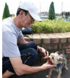
大切に飼いましょう