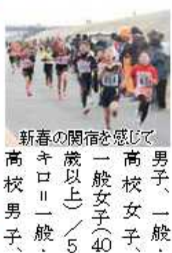
感じて、宿を、関を、春の、新、高校男子、

ロ(親子(就学前の子と親)、小学1～3年/2キロ)小学4～6年、中学女子/3キロ)中学男子、一般、高校女子、一般女子(40歳以上)/5