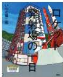
「ロケット発射場の一日」 いわた 徳二郎・作・絵 講談社

4年に1度の舞台で、強豪国に負けない強さと走りや銀メダルを獲得した40メートルリレー。日本の伝統であるバトンパスを進化させ、勝ち取ったメダル。4人の選手で作る物語です。