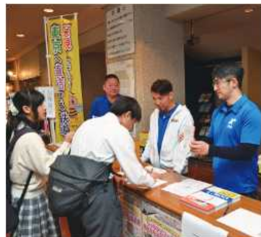
2030年までの開通実現を目指す

野田と東京をつなぐ鉄道建設の機運を盛り上げようと10月14日、「東京直結鉄道建設・誘致促進大会千葉ブルック大会」が文化会館で開かれた。元オリンピック体操選手・鶴見虹子氏の講演後、式典で関係者が建設に向け、あいさつ。来場した女性は「子どもの進学、就職の可能性が広がるので期待したい」と話していた。