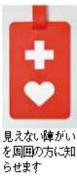
障がいの方には周知を促すため、ヘルプマークを配布します。

※郵送では送付しませんが来られない方はお問い合わせください。 【問合せ】障がい者支援課 【HP検索】1011890