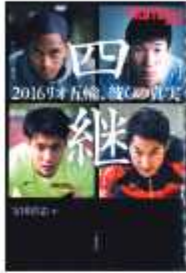
「四継」 宝田将志・著 文藝春秋

東原図書館 ☎ 7123-7611 南図書館 ☎ 7125-7381 北図書館 ☎ 7129-8811 せきやと図書館 ☎ 7198-4046