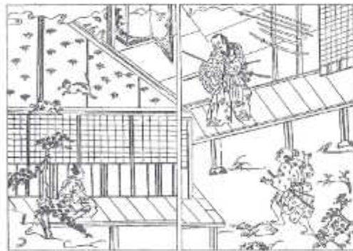
明治維新の偉人「山岡鉄舟」が愛読した話述も