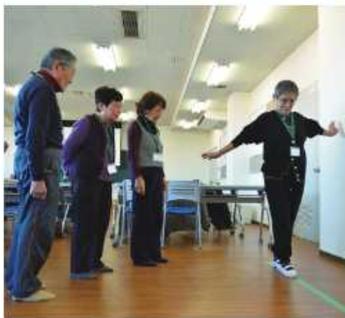
19講座を日替わりでほぼ毎日開催

多様な人々が利用できます。車いす利用者が使用できる広さや手すりに加え、オストメイト(人工肛門等保有者)対応の設備や大人から子どもまで衣服の着脱やおむつ交換ができる大型シート(ユニバーサルシート)などを備えるところもあります。このトイレは、どなたでも利用できますが、このトイレを必要とする方がいらっしゃいます。一般トイレを利用できる方は、長時間の利用は控え、マナーを守り、「ゆずりあいの気持ち」を持って利用してください。