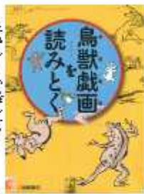
「鳥獣戯画 読みとく」 五林文彦・監修 岩崎書店

郵便局で押される「風景印」を集め始めた著者が、郵便局巡りの道中をエッセイにまとめた。集めることから広がる楽しみが垣間見え、真似をしてみたいくなります。