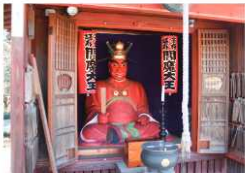
平成2(1990)年に野田市の有形文化財に指定