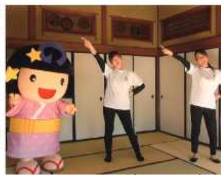
約15分間で踊りを解説(写真は正面視点)

普及の第一歩として、小・中学校の運動会や文化祭などの学校行事に取り入れてもらえるように、市内の全小・中学校にDVDを配布しています。