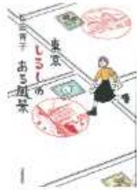
「東京 しろしめのある風景」 松田 青子・著 河出 書房新社

奥の細道 7123-7611 南の国 7125-7361 北の国 7129-8811 せきやと 7198-4946