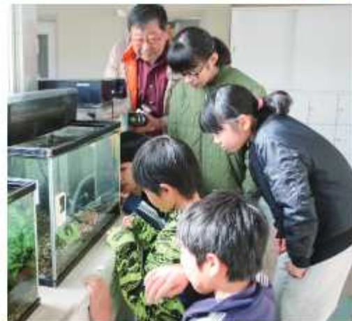
2月下旬には利根川に放流予定(中央小で撮影)

自然の魅力や命の大切さを知ってもらおうと、野田東ロータリークラブは中央小と宮崎小、岩木小でサケの稚魚を飼育している。教科書にサケが登場することから児童も生態に詳しく、昼休みに観察するという児童は「おなかの栄養素が小さくなってきた」「体の色が変わってきた」と成長著しいサケに愛情を持って見守る様子だった。