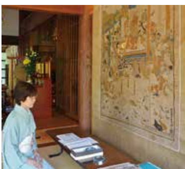
さまざまな人物や動物を表現