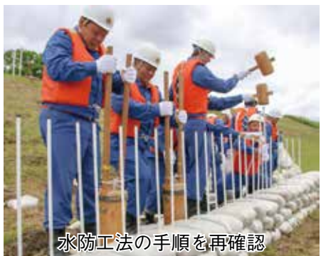
水防工法の手順を再確認