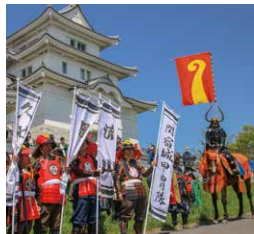
武者行列の先陣を切る南相馬市の駿馬

と個性を認め合い、互いに支え合いながら暮らしています。例えば、会話が苦手な人には、ゆっくり短い表現で話したり、写真や絵を添えて話をしたりなどの配慮で、穏やかに接することを心がけましょう。1人1人の思いやりが共に生きる社会の実現につながります。4月2日は「世界自閉症啓発デー」であることから、市では、5月11日から6月10日まで、興風図書館で「自閉症」に関する本の特集コーナーを開設しますので、皆さんの理解を深めていただくきっかけにしてください。