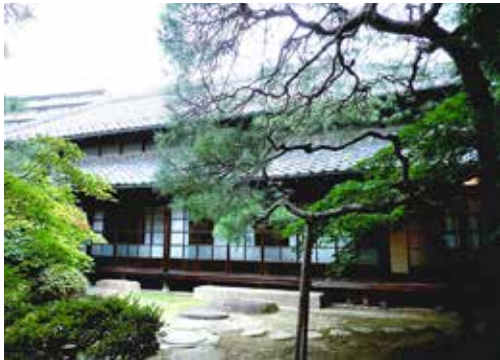
所有者に大切に受け継がれ登録有形文化財に