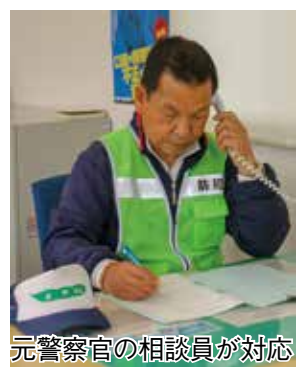
元警察官の相談員が対応

調査結果は、国や地方公共団体の行政施策の重要な基礎資料として利用されるとともに、企業、大学などでの研究資料、小・中・高等学校の教材など、広く