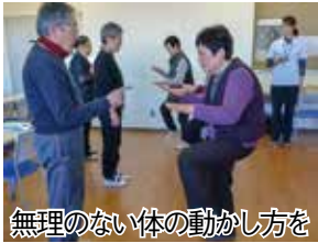
無理のない体の動かし方を

月曜日から金曜日まで(祝日を除く)のおおむね毎日開校し、事前申込は不要で、どなたでも気軽に立ち