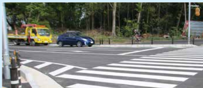
船形吉春線と国道16号の交差点(国道16号から撮影)