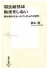
「羽生結弦は助走をしない」

興風図書館 ☎ 7123-7611 南図書館 ☎ 7125-7981 北図書館 ☎ 7129-8811 せきやど図書館 ☎ 7198-4946