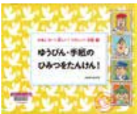
「ゆうびん・手紙のひみつをたんけん！」