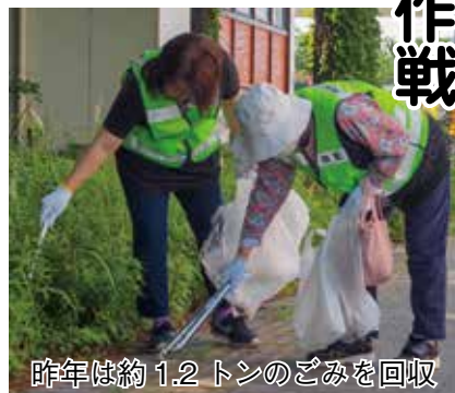
昨年は約1.2トンのごみを回収

【集合場所】①ゴミゼロ運動Ⅱ勤労青少年ホーム、イオンノア店 遊園地側駐車場(日光街道沿い)、花井児童遊園②江戸川クリーン大作戦Ⅱ玉葉橋下手、今上八幡神社前、野田橋下手、江戸川自動車前、川間鉄橋下手、金野