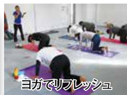
ヨガでリフレッシュ

（5月25日は除く）の ④ 14時～16時。20歳以上。各回50円。 ② キレイになるハタヨガ：