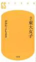
「琉球女子」 大東あさ子 著 おたまさこ 著 幻冬社

興風図書館 7123-7611 南図書館 7125-7381 北図書館 7129-8811 せきや図書館 7198-4946