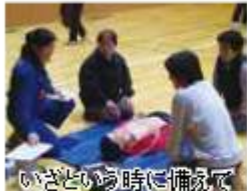
いざという時に備えて

◆普通救命講習会 7月22日(日)13時30分～16時30分関宿総合公園体育館で。高校生以上。先着15人。申込みは6月5日(日)～7月10日(日)9時