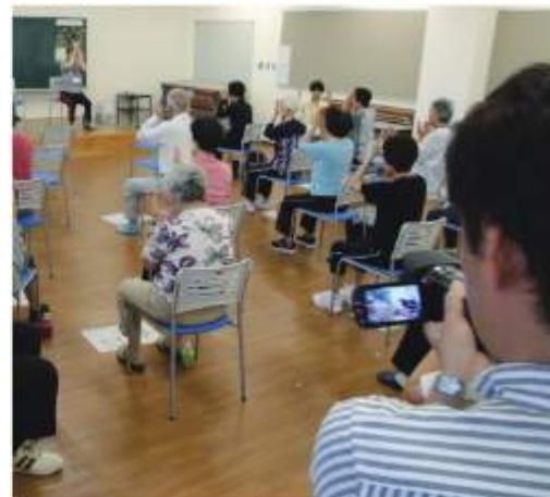
シルバーリハビリ体操の様子を事前収録

体的虐待」や「性的虐待」、「心理的虐待」、「放棄・放置(ネグレクト)」、「経済的虐待」があります。 ◎通報や相談を受け付け 市は、障がい者支援課内に「野田市障がい者虐待防止センター」を配置し、虐待への通報や相談を受け付けています。匿名でも通報・相談できますので、同センター ☎7123・1691(平日8時30分～17時15分)へ連絡してください。 ※右記以外の時間は、7125・1111(市役所代表番号)で守衛が応対し、担当者へ連絡します