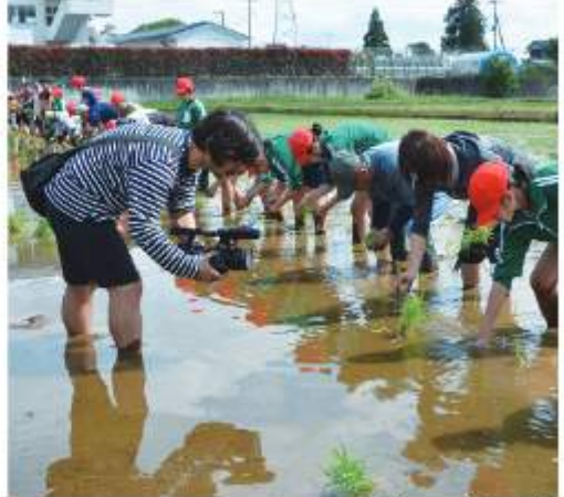
あいちそと運動推進委員会開宿支部と開宿水環境保全会の協力で実施

総合的な学習の時間 をテーマにしたNHK のEテレ番組「ドスル コスル」の収録が5月 10日、開宿小学校で行 われ、5・6年生49人 が田植えに挑戦する様 子が撮影された。 今後も伝統食の授業 や9月の稲刈りなどの 取材が続く、来春以降 に、「食の大切さ」を学 ぶ同校の取り組みが番 組で紹介される予定。 ※番組は毎週9時45分