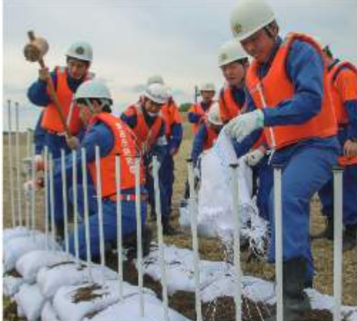
土のうを積んで増水した川の越水を防ぐ

台風やゲリラ豪雨な どによる洪水など万が 一の水害に備え、水防 工法を向上させようと 水防演習が5月13日、 スポーツ公園(木野崎) で行われた。 消防団員や消防職 員、市職員など約50人 が参加。木流しや月の 輪などの演習を通じて 工法の手順と効果を再 確認し、今後の時季に 懸念される水害への対 策を万全にした。