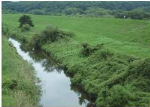
オランダ人技師ムルデルが設計