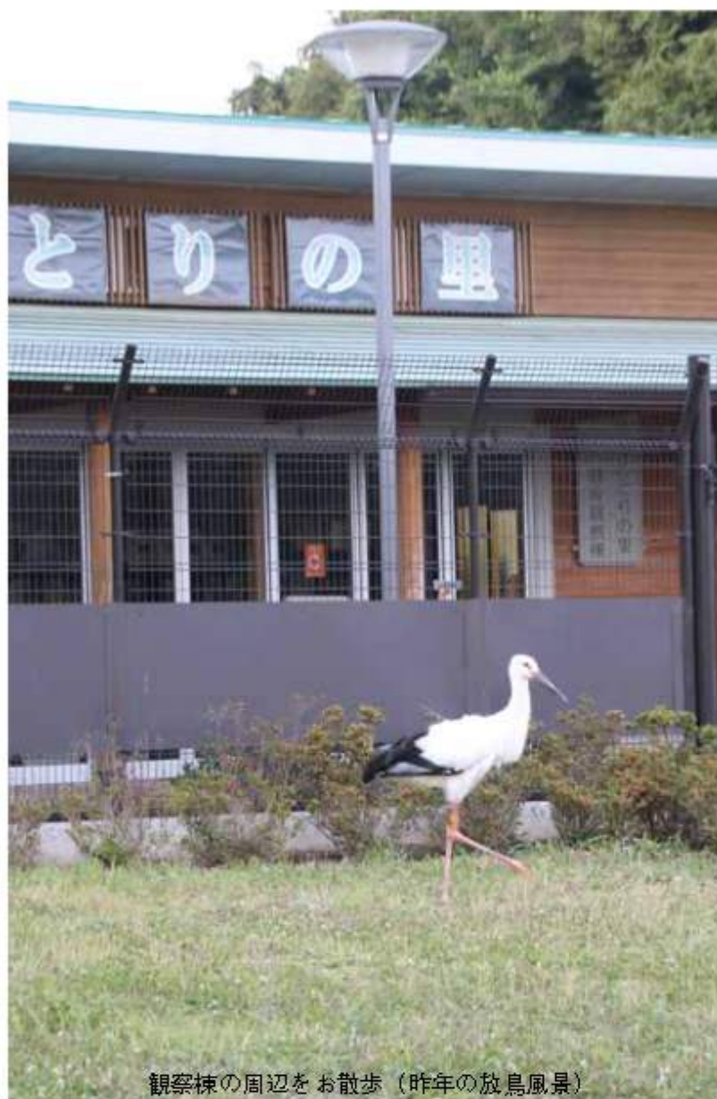
観察棟の周辺をお散歩（昨年の放鳥風景）