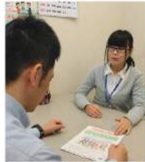
相談は対面や電話で受付

「障害者虐待防止法」は、障がいのある人に対する虐待の禁止や虐待を発見した場合の通報義務を定めたりすることで、障がいのある人の尊厳を守り、虐待防止に取り組む法律です。養護者や福祉施設従事者、使用者(雇用主)による虐待には「身