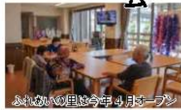
ふれあいの里は今年4月オープン