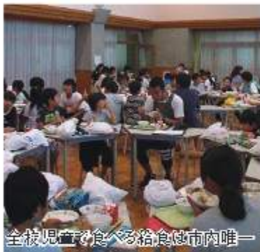
全校児童で食べる給食は市内唯一

合い、教え合う異学年交流学習では、全校で食べる「ふれあい給食」や「全校遠足」、「全校ぐんぐん遊び」など、集団ルールやマナーを体験的に学ぶことができます。 ◆入学の検討に見学や相談を 31年4月1日から入学を予定する児童を募集しています。 学校敷地内にある学童保育では、1年生から6年生までを19時まで受け入れています。 学校見学や相談は、いつでも可能です。 1年生以外の学年の児童で、市内の別の小学校からの転入も可能です。 【定員】各学年とも16人(すでに在籍中の児童数を含む) 【問合せ】学校教育課、福田第二小学校 ☎71338・0355 【HP検索】10000535