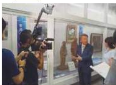
番組は8月19日19時54分から放送予定

ジャーナリストの池上さんが、8月14日のご聖断の状況や、貫太郎直筆のメモ、往時を描いた油彩画など、終戦時の内閣総理大臣ゆかりの品々を解説を交えながら紹介した。