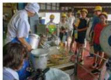
栄養士や調理師に直接質問も

「食べ残した給食が水気を切るなどの処理後に、豚の餌になる過程を学習。「家や学校でどうしたらフードロスを減らせるのか考えたい」と話す児童もいた。