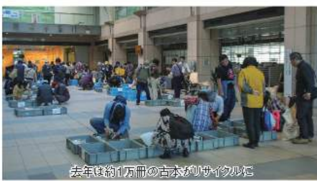
去年は約1万冊の古本がリサイクルに