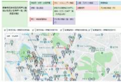
利用区分ごとに色分けし地図上に見やすく配置