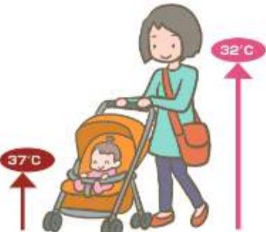
地面により近いベビーカーは注意

3、熱中症予防は保健センター ☎7125・1188 【HP番号】救急車利用は1001216、熱中症予防は1006455