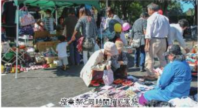
産業祭と同時開催で実施

市では、ごみの減量とリサイクルの推進のため、10月13日(日)に市役所を会場に「野田市リサイクルフェア」を開催します。 当日は、フリーマーケットやおもちゃ病院、古本市を開催します。