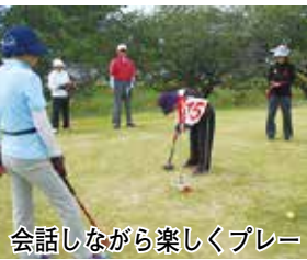
会話しながら楽しくプレー

①ズンバ教室：9月11日～10月23日（9月18日、25日、10月9日を除く）の毎10時～10時45分。全4回。ラテン音楽に合わせたダンスフィットネスエクササイズ。20歳以上。2千540円。運動できる服装。②グラウンド・ゴルフ大会：10月30日（雨）9時～16時。20歳以上で、スコアカードの記入ができる方。192人（抽選）。500円。クラブとボール、黒ボールペン持参。申込みは①は電話か直接、②は9月23日