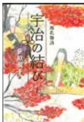
「宇治の結び 上・下」 紫式部・著 萩原規子・訳 理論社

興風図書館 ☎ 7123-7611 南図書館 ☎ 7125-7981 北図書館 ☎ 7129-8811 せきやど図書館 ☎ 7198-4946