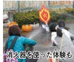
消防自動車見学 9月27日 10時30分〜11時30分文化センター駐車場。平成28年4月1日以前に生まれた子