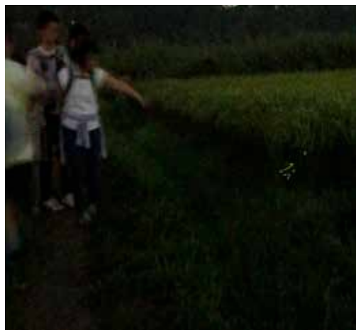
幻想的なホタルの光に感嘆の声が漏れる

自然を守りながらの水田耕作を市民に提供している野田自然共生ファームでは、ホタルの観察会を8月4日に開催した。水田型市民農園の参加者など約160人が、ホタルの種類や生態の説明を聞いたりしながら、暗くなるのを待って、夜の江川地区を散策。田んぼに生息するヘイケボタルが稲穂の上で柔らかな光を放っていた。