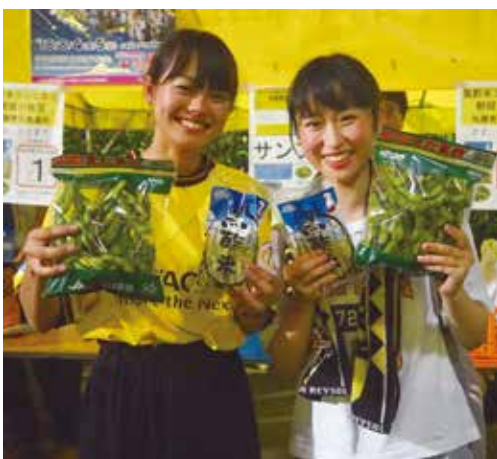
黒酢米は野田のブランド農産物

柏レイソルの野田ホームタウンデーが8月1日に三協フロンテア柏スタジアムで開催された。市は、ちば東葛農業協同組合と共催で、減農薬・減化学肥料で栽培された黒酢米と日本有数の生産高を誇る枝豆が当たる抽選券を配布。当選者100人に渡り、特産品をアピールした。会場では「初めて食べるので楽しみ」などの声がかかれた。