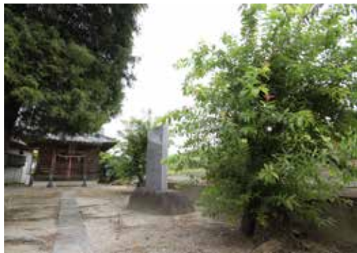
右側手前が子柳で石碑の奥側が孫柳と伝わっている