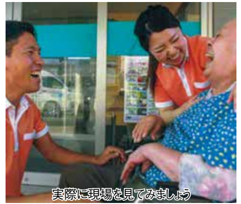
実際に現場を見てみましょう