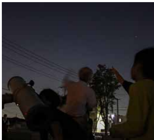
火星のほかに金星・木星・土星も観測

15年ぶりに地球に大接近する火星を観察しようという「夏の星空観覧会」が8月1日、川間公民館で開催された。参加した親子は、地球や火星、宇宙の大きさなどを学習後、19時40分ごろから観測を開始。学習で火星に白く輝く極冠があることを知った子どもたちは天体望遠鏡をのぞき、「極冠が見えた」と興奮した様子だった。