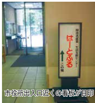
市役所出入口近くの看板が目印

障がいがあっても、周囲の配慮や職場環境の整備などの支援があれば働くことができます。公共職業安定所や地域障害者職業センターで相談を受け付けているほか、県内には、16か所の障害者就業・生活支援セン