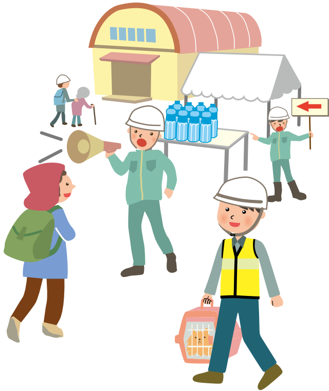
ペットを同行避難する際はキャリーバッグなどで