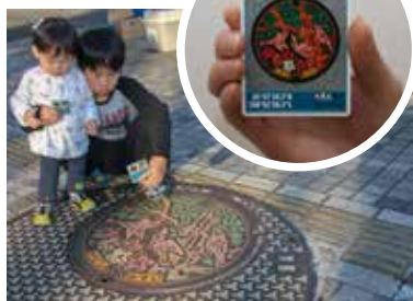
カードにはマンホールの位置情報も