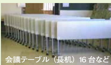
会議テーブル(長机) 16台など

で、事業に採択された堤台第1自治会が250万円の助成金で自治会活動に使用する用品を整備。