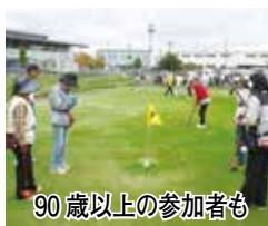
90歳以上の参加者も