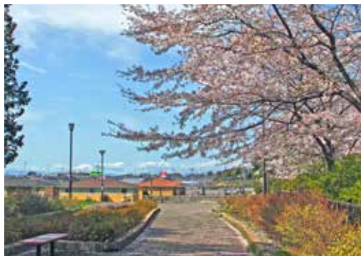
空気が澄んだ日は富士山（左下）が桜の背景に