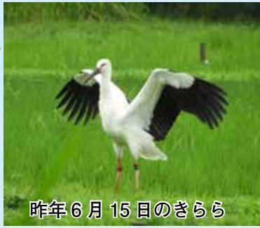
昨年6月15日のきらら